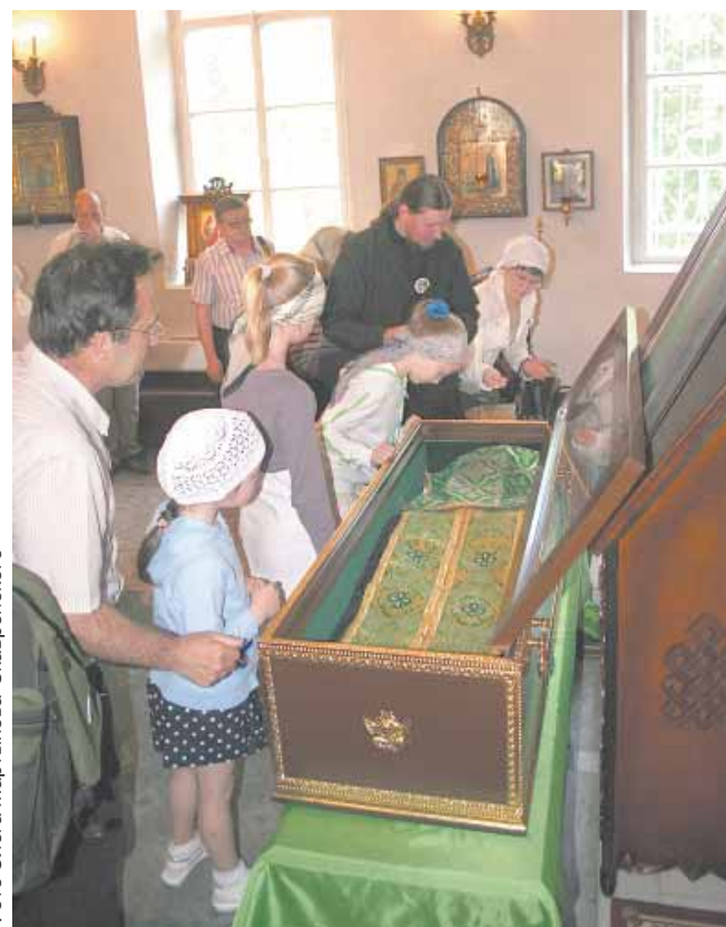
Святые мощи преподобного Макария Калязинского