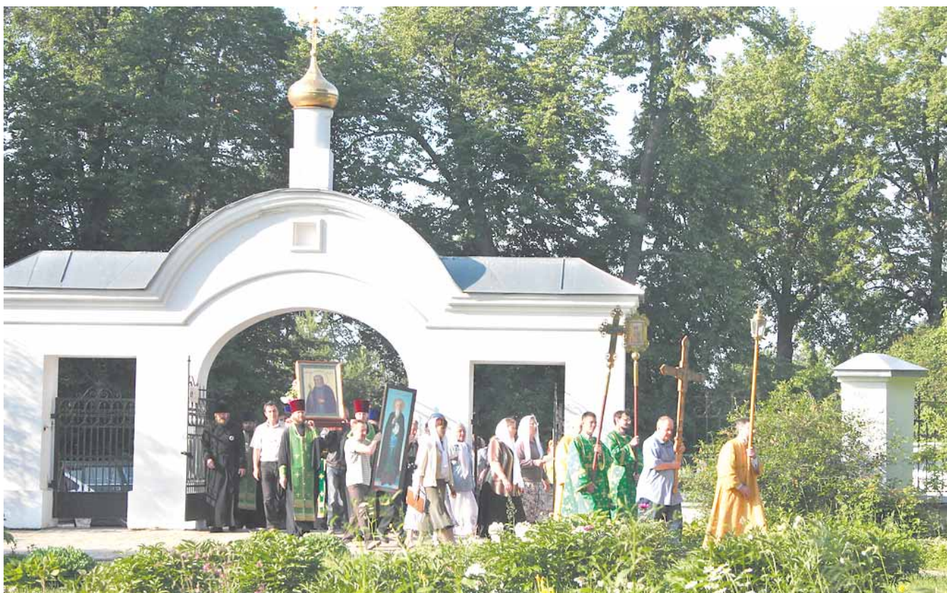
Крестный ход у храма Похвалы Пресвятой Богородицы в Ратмино

ним из центров православия в этих землях. В этом монастыре в 1466 году русский купец-путешественник Афанасий Никитин получил благоухание, седины старца были чисты, и даже ризы не изменились». В 1700 году для мощей благочестивыми жертвователями была устроена новая серебряная рака, и в ней угодник Божий почивал вплоть до закрытия монастыря советской властью. Троицкий Калязинский монастырь, который основал преподобный Макарий, был од-