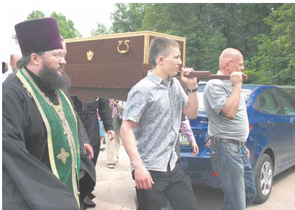
Проводы Крестного хода

Материал подготовил Олег М. Мартынов-Скавронский