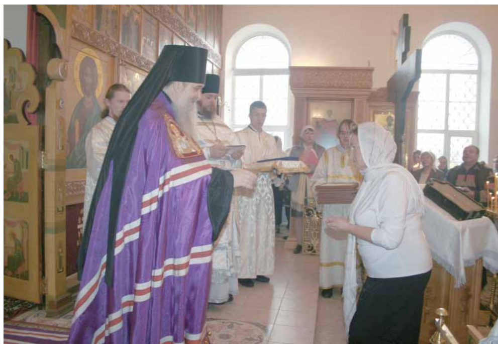
Вручение церковных наград

Торжественный архиерейский чин богослужения сообщал особое молитвенное настроение всем, кто пришел сегодня в обнов-