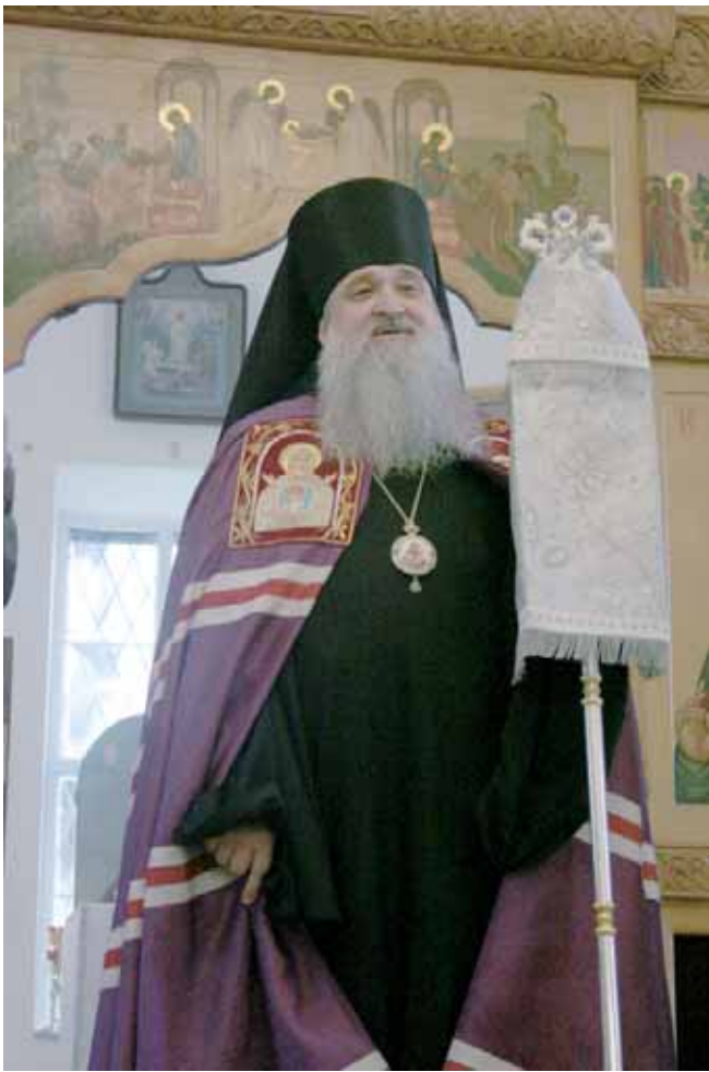
Преосвященнейший епископ Серпуховской Роман

И вот зазвучал торжественный трезвон, и под сводами храма вступил его преосвященство владыка Роман, епископ Серпуховской, викарий Московской епархии.