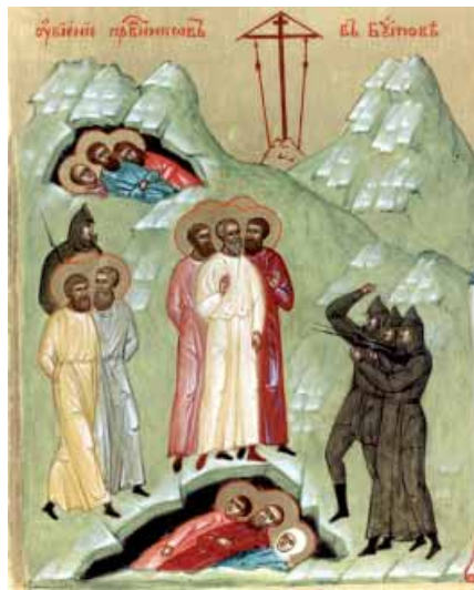
Убиение праведников в Бутове. Икона XX в.