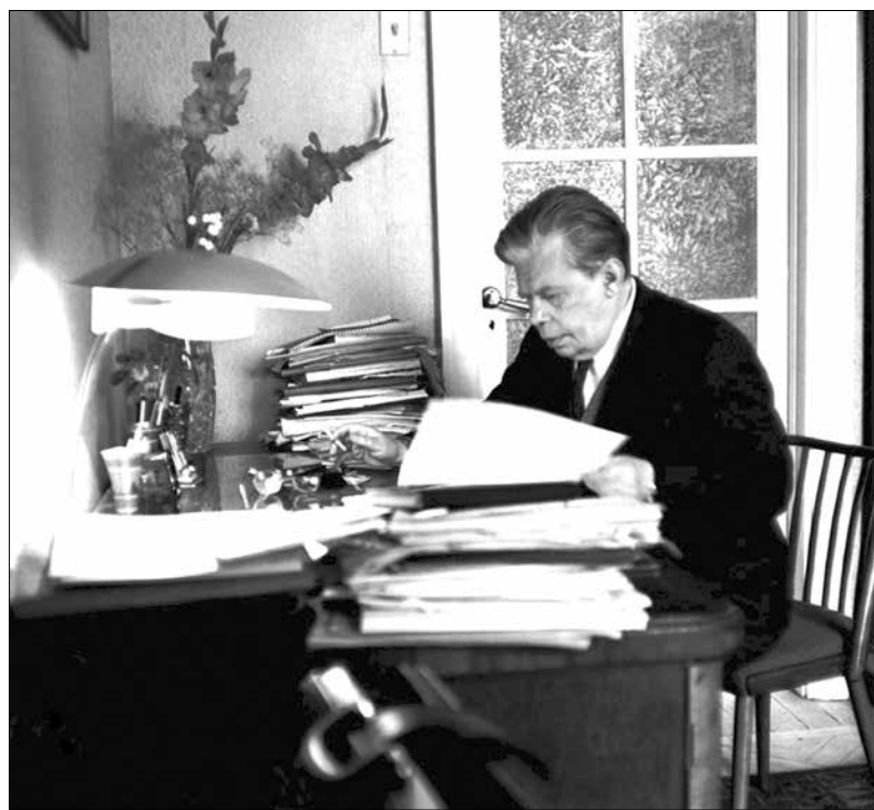
Академик Н.Н. Боголюбов за работой

30-е годы – это еще и годы вхождения Боголюбова в большую науку, годы многочисленных публикаций, его удивительной работоспособности и признания как ученого в СССР и в мире, первой поездки за рубеж, сначала в Берлин, затем в Париж.