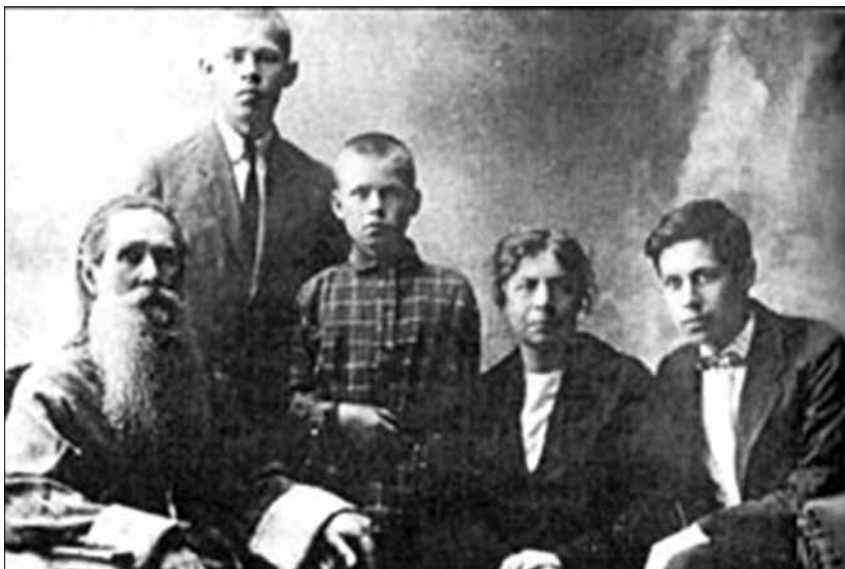
Отец академика Н.Н. Боголюбова протоиерей Николай Михайлович Боголюбов в кругу семьи

В 1917 г., перед гимназией, братьям подарили атлас Шокальского – оба любили географию. Котя решил поделить земли между братьями. Цветными карандашами на карте он выделил себе лакомые куски зеленого цвета. Брату достались только желтые пустыни. После протеста Котя выделил ему ещё один большой кусок, но и это оказалось пусты-