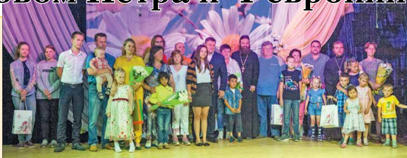
Празднование Дня любви, семьи и верности в Дубне

8 июля по всей России празднуется День семьи, любви и верности, а православные христиане отдадут дань памяти муромским святым Петру и Февронии – покровителям супружества и семьи. В этот день в храмах Дубненско-Талдомского благочиния прошли Божественные литургии и молебны. Священники благочиния принимали участие в городских и сельских мероприятиях Дубны и Талдомского района, посвященных государственно-церковному празднику.