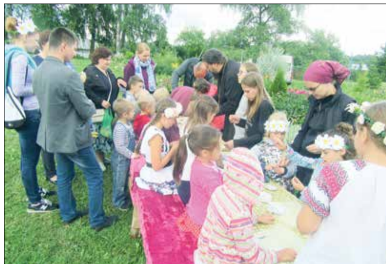
Фестиваль «Под покровом Петра и Февронии» в селе Старая Хотча

В ТАЛДОМЕ состоялся традиционный Парад детских колясок, приуроченный ко Дню семьи, любви и верности. Семьи продемонстрировали творческие способности, превратив коляски в ори-