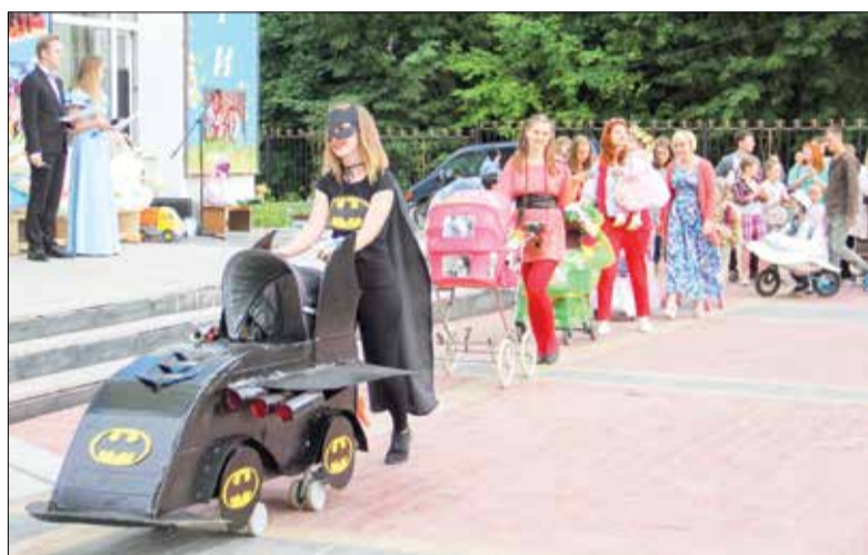
Парад колясок в Талдоме