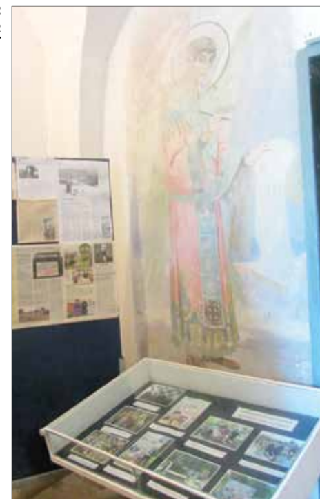
Пока музей выглядит так