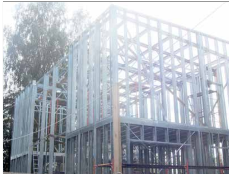
Строительство музея в селе Спас-Угол