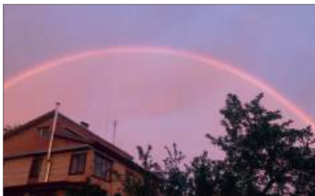
Дубна, 5 июня 2020 г.

Господь Бог поставил радугу знаменем Своего завета с Ноем, что Он по благодати Своей не наведет более потопа на землю за грехи людей.