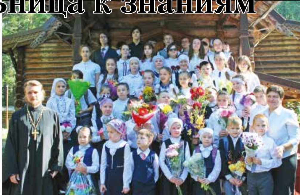
Православная гимназия «Одигитрия» Смоленский храм Дубна

Я не сторонник того, чтобы ребята были успешны во всем, на сто процентов разбираться во всем невозможно. Но на практике видим, что формы обучения в гимназии позволяют воспитанникам реализовать свои способности, стать людьми, полезными стране и, прежде всего, нашей Церкви. Видеть ситуацию, верно её анализировать – это сложно, но то образование, которое предлагает гимназия, дает положительные результаты. Ребята прекрасно прошли испытания даже в непростых из-за пандемии условиях. Я рад, что они могут идти подготовленные строить дальше свою жизнь и в перспективе строить жизнь страны. Уверен, они будут видеть в своем служении не только техническую часть, а будут стараться думать о сущности, о проблемах бытия.