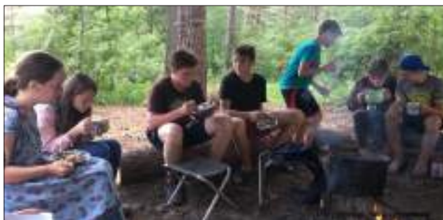
Ужин... или завтрак

После купания богатырей все захотели попить чаю, и обнаружилось, что печенки забыли в лагере. Но ничего, попили чай без всего и заторопились назад. Когда мыплыли по протоке, казалось, будто ты находишься в царстве Берендея. Все вокруг напоминало сказку. Листья, желтые бутоны кувшинок. Тихие и задумчивые, будто волшебные деревья... Вообще, и на Селигере, и на Щучьем, и на Белом очень красивая природа.