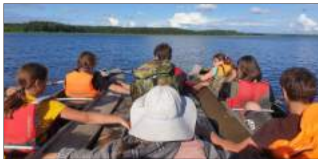
На байдах нам все нипочем

А после крестного хода все проходили под святыми мощами, украшенными розами и дубовыми листочками. Мне тоже досталась розочка. Кстати, всех волновала мысль, будет ли дождик. И, как специально, в честь такого великого праздника светило солнце, и о дожде даже речи быть не могло. Еще, что касается монастыря, могу сказать, что к монахам испытываешь невольное уважение: они посвятили свою жизнь Богу, молитвам и духовному посту. Мне кажется, что это большой подвиг: постараться забыть все мирские страсти и уйти в монастырь – место, где трудиться не переставая, и где все остальное время посвящено общению с Богом. Поэтому