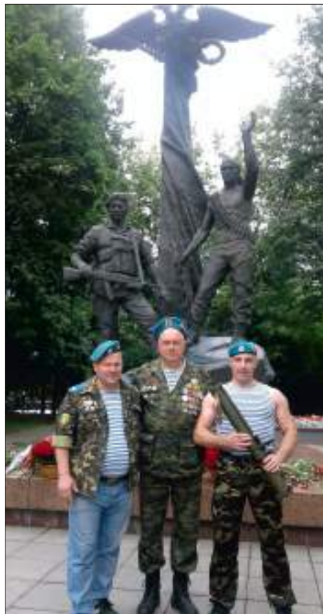
Десантники Талдома у памятника десанникам в Москве