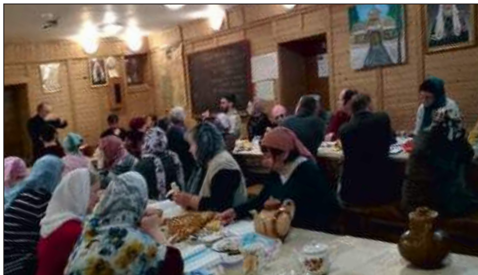
В подклети Смоленского храма. До карантина

Когда Кая похищала Снежная Королева, он хотел вспомнить «Отче наш...», но в голову приходила только таблица умножения. В советской редакции сказки этот момент пропущен, и учили нас, в первую очередь, таблице умноже-