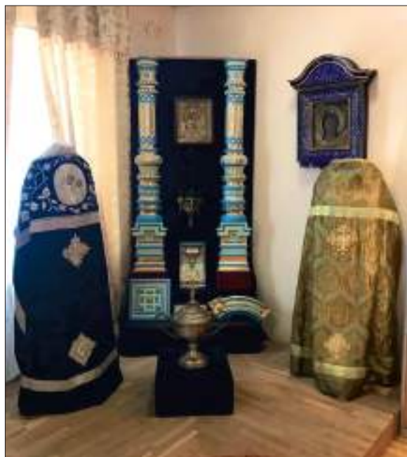
Фрагменты иконостаса в экспозиции Талдомского музея