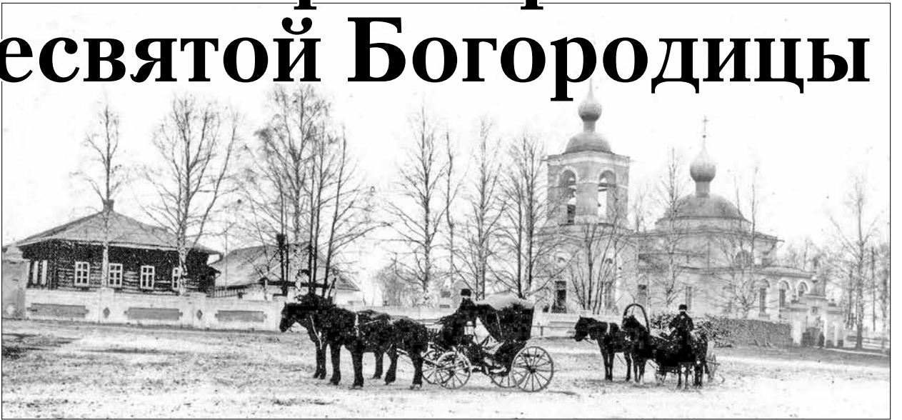
Храм Похвалы Пресвятой Богородицы до реконструкции, 1907 - 1914