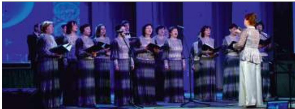
Академический хор ДК «Октябрь»