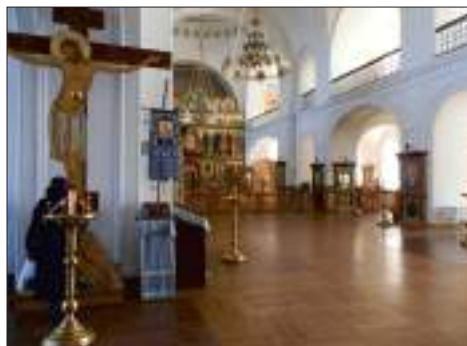
Шамордино. Казанский храм

Утром следующего дня ветер стих, выглянуло солнце и все вокруг буквально преобразилось. С особым радостным настроением наши паломники поспешили на раннюю Божественную литургию в уже полюбившийся Казанский храм. И снова удивительное пение братского хора, возгласы многочисленных священников и диаконов, дружное многогласное мужское пение – такое нынче бывает только в мужских монастырях. Излишне говорить, что большинство наших паломников исповедались и с благоговением приступили к Святым Христовым Тайнам.