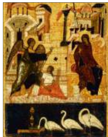
Благовещение. Икона XVI века из Суздальского Покровского монастыря

Однако возникает вопрос: при чем тут лебеди? Из греческой мифологии в европейскую культуру проникла тема «лебединой песни»: якобы лебеди перед смертью поют песню необыкновенной красоты и после этого умирают. Таким образом, лебедь оказался прочно связан с темой смерти, а идея лебе-