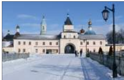
Оптина пустынь. Святые врата

Раннее утро 7 марта начиналось с метели, которая с каждым часом только усиливалась. У нас были опасения, что погода внесет свои коррективы в отлаженный график поездки. Но, видимо, испугавшись метели, многие в этот день никуда не поехали, и мы необыкновенно удачно миновали Москву.