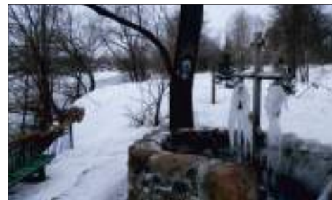
Источник прп. Сергия

был основан прп. Амвросием Оптинским и окормлялся им до самой его блаженной кончины. К святому часто обращались за помощью одинокие, больные, увечные женщины,