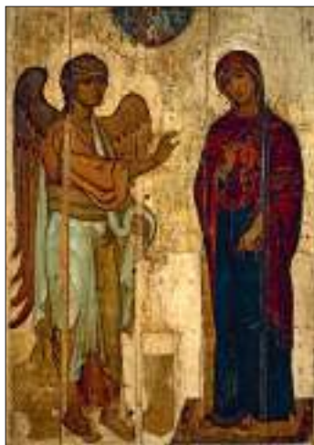
Благовещение Устюжское. Икона XII века из Успенского собора Московского Кремля

В Великом покаянном каноне свт. Андрея Критского есть такие слова: «Яко от обращения червлени-