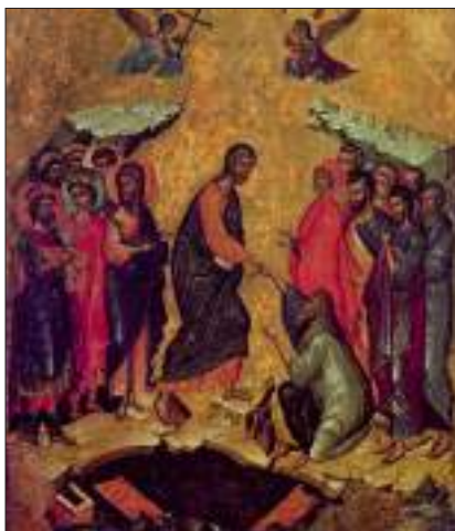
Сошествие во ад. XIV – нач. XV в. Эрмитаж

«Сошествие во ад» является каноническим типом иконографии, которая соответствует литургическому воспоминанию Великой Субботы и Праздника Пасхи. В ней отражено традиционное учение Церкви о