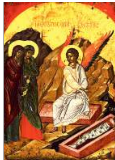
Явление ангела мироносицам. 1546 г. Афон

Пока они препирались, раздался голос, «грому подобный» и клич Ангелов: «Возмите врата князи ваша, и возмится врата вечная: и внидет Царь Славы!». Ад испугался: «Кто есть сей Царь Славы?» И от-