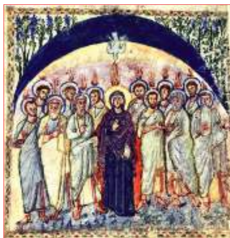
Сошествие Святого Духа на апостолов, Евангелие Рабулы, 586 г., Сирия

Развитие иконографии праздника начинается с VI века, его изображения появляются в миниатюрах, мозаиках и фресках. В одном