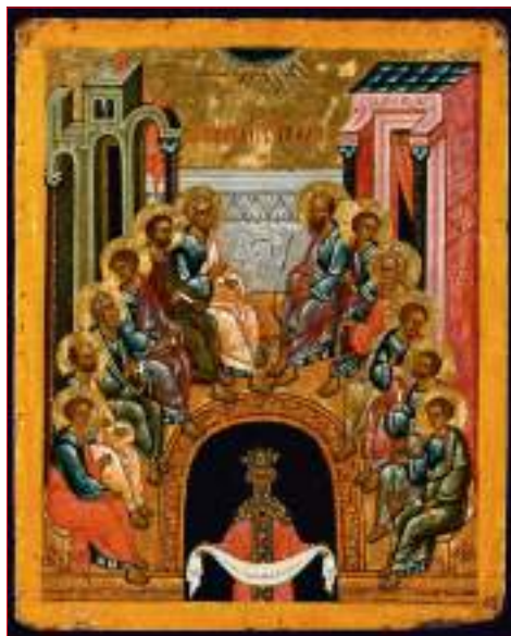
Сошествие Святого Духа на апостолов. Новгород, XV век

Наконец, мы подходим к самому трудному для понимания моменту в иконографии праздника Пятидесятницы. Постепенно «племена и языцы» в черном проеме стали заменяться неким старцем в царских одеждах и короной на голове. В руках у него плат с двенадцатью свитками. Внешне он походит на царя Давида, однако надпись рядом с ним объясняет, что это – Космос. Кто же этот загадочный персонаж?