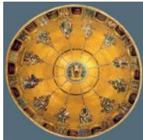
Сошествие Святого Духа на апостолов, купол собора Сан Марко, Венеция

может служить мозаика XIII века в куполе собора святого Марка в Венеции.