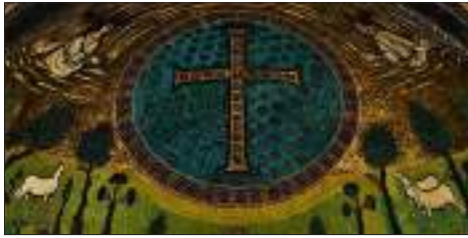
Преображение Господне. Мозаика апсиды церкви Сант-Аполлинаре-ин-Классе. VI век. Равенна, Италия

Петра, Иакова и Иоанна заменяют три овечки, пасущиеся среди редких деревьев.