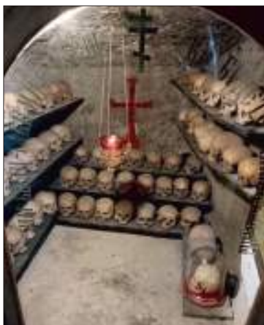
В Свято-Климентовском монастыре, Инкерман

обители начинается с I века. Наиболее древней является, возможно, пещера, высеченная самим святым Климентом – Римским папой, который был сослан в 98 году импера-