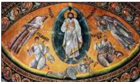
Преображение Господне. VI век. Мозаика апсиды монастыря св. Екатерины, Синай

Уже следующая по времени сохранившаяся мозаика Преображения в алтаре собора монастыря св. Екатерины на Синае (VI в.) представляет композицию вполне узнаваемую, которая в основных своих элементах сохранилась до настоящего времени. Единственное отличие – отсутствие гор, на которых обычно стоят Христос и пророки.