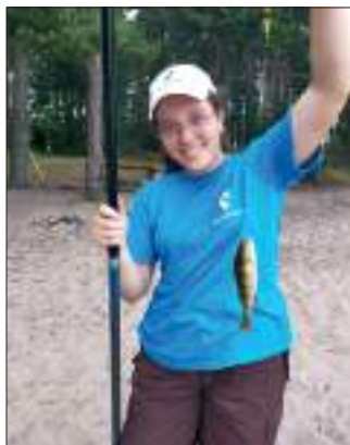
Мы умеем не только на винограднике работать

все больше и больше. После сытного завтрака мы мыли посуду в прохладной воде озера. Не забыв спасательный жилет, или, как его все называли, спасик, и дождевик, мы плыли в монастырь на трудовой подвиг. То мы очищали высокие лестницы, которые стоят при каждом входе в храм, от зарослей и мха, то пропалывали в теплицах огурцы, помидоры, лук. Но когда, наконец, выглянуло наше золотое солнышко, мы уже работали на виноградниках, по крайней мере, девочки, а мальчики работали над восстановлением памятника. После четырех часов работы под палящим солнцем так приятно умыться холодной водой. Вслед за этим – обед. Каждый день горячий суп, гарнир, вкусные салатки, компот или квас с печенькой или с кусочком коврижки. И вновь возвращаемся мы к лагерю, сплавляясь по прохладной, свежей водичке.