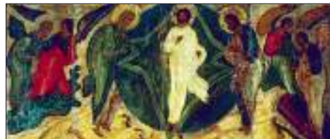
Преображение Господне. Новгородская икона. XVI век

По словам Иоанна Златоуста, Преображение произошло «дабы показать нам будущее преобразование естества нашего и будущее Свое пришествие на облаках во славе с ангелами». Таким образом, духовное содержание иконы Преображения имеет эсхатологический характер: Христос находится между пророками, символизирующими начало и конец мира. Моисей был основателем ветхозаветной церкви, а Илия явится в конце времен как провозвестник Второго пришествия Христа.