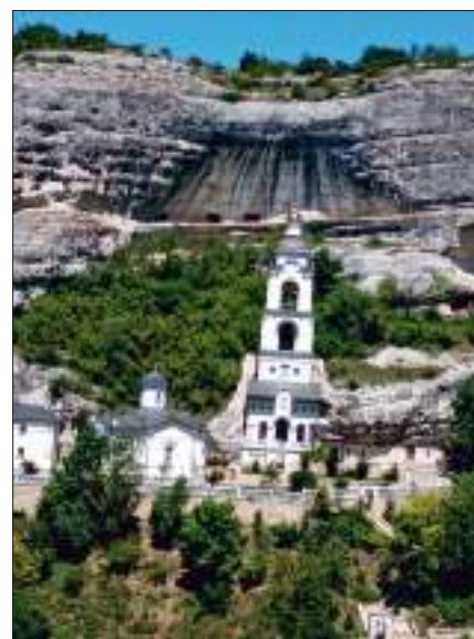
Свято-Успенский мужской монастырь, г. Бахчисарай

Свято-Успенский монастырь в XV-XVIII веках был центром православного христианства на Крымском полуострове. Чудотворная икона Божией Матери почитается даже мусульманами. Там же находится святой источник. Очень приятное место для молитвы.