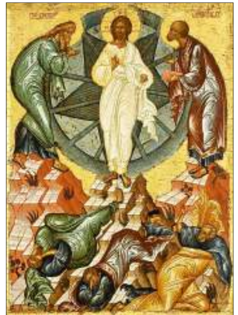
Преображение Господне. Новгородская икона. XV век

Неизменным атрибутом сюжета Преображения является святящаяся мандорла – символ божественного, нетварного или, как стали его называть, фаворского света. Иногда внутри мандорлы ясно видна пятиконечная звезда, что у современного человека вызывает немалое смущение, поскольку пентаграмма часто употребляется в масонской и оккультной символике.