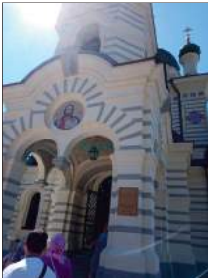
Храм Воскресения Христова, Форос

в 1892 году на обрывистом утесе – Красной скале. Это памятник русской архитектуры конца XIX века. Храм посвящен чудесному событию: 17 октября 1888 года импе-