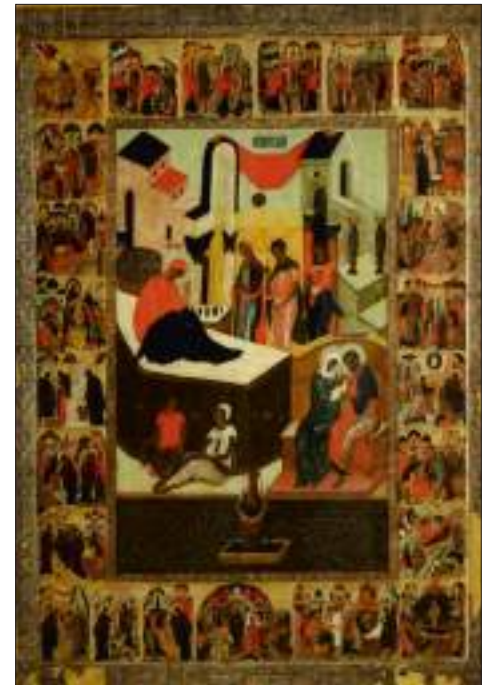
Рождество Богородицы. Рождественский собор Антониева монастыря. 1560-е гг.

Рождества Богородицы: «Радуйся, пустыня жаждающая, да веселится пустыня и да цвете, яко крин... И на жаждающей земле источник водный будет. Тамо будет веселие птицам... И собрании Господом обратятся и придут в Сион с радостью» (Ис. 35:1-10).