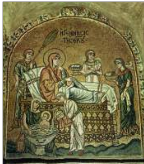
Рождество Богородицы. Мозаика в Дафни (Греция). 2-я пол. XI в.

же трактовка возможна и в данной композиции. Это подтверждают тексты молитв, посвященных празднику Рождества Богородицы, в которых есть слова о рождении Матери Божией и о будущем очищении человечества. Согласно протоевангельскому рассказу, «чистых дев» приглашает Анна ухаживать за своей дочерью, поэтому в сцене омоения обычно представлены одна или две юные девы. В дальнейшем в композиции появляется служанка, качающая колыбель, и служанка, обмахивающая Богородицу опахалом. Эта колыбель напоминает каменные ясли Христа в композиции Рождества Христова, сцена воспринимается как прообраз этого события. Подтверждением тому служат тексты служб, посвященных празднику Рождества Богородицы. «Радуйся, Иоаким, Сын будет рожден Дочерью!» – пишет Иоанн Дамаскин.