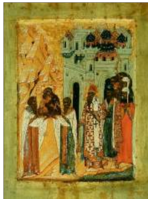
Сретение Владимирской иконы Пресвятой Богородицы

На месте встречи Владимирской иконы митрополит Киприан основал Сретенский монастырь, а день 26 августа (8 сентября по новому стилю) празднуется с тех пор как день спасения Москвы и России от полчищ Тамерлана.