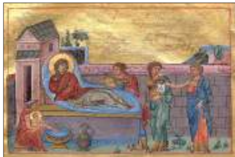
Рождество Богородицы. Минологий Василия II. 985 г.

Образ самой Божией Матери не занимает центрального места в композиции, это говорит нам о высоте Ее будущего смирения. Композиция Рождества Богородицы отличается разнообразием изображений дев с дарами и служанок. Дева, подносящая дары, присутствует уже на одном из самых ранних памятников – миниатюре из Минология Василия II (979-989 гг.).