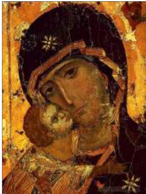
Владимирская икона Божией Матери

В Москву пришла страшная весть: с юга к городу двигались полчища Тамерлана (Тимура) – непобедимого и жестокого завоевателя. Непобедимого в прямом смысле этого слова: за всю свою долгую жизнь он не потерпел ни одного поражения. Тамерланом были завоеваны Персия, Ирак, Армения, Азербайджан, Месопотамия, Грузия, Индия и Сирия. К концу жизни Тамерлана, в 1405 году, его владения с востока на запад простирались от Черного моря до реки Ганг, а с севера на юг – от Аральского моря до Аравийского.