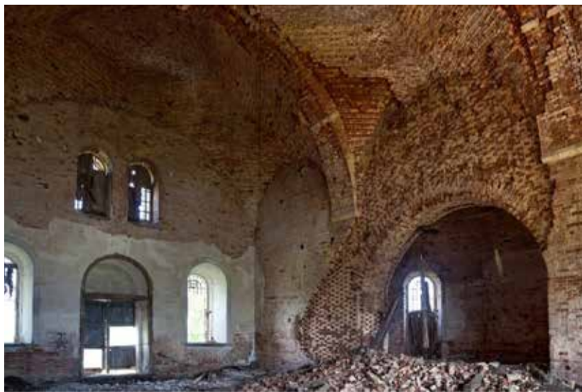
Иоанно-Богословский храм с. Богослово. 2016 г.

Сложить в стопку — это один из вариантов. Греха в этом нет, если иконы будут храниться в приличном месте. Но лучше всего найти, кому можно их отдать. Самое простое — отнести в храм. Ещё можно отправить их миссионерам, которые помогают бедным православным приходам за рубежом (в Африке, Южной Америке и проч.) или у нас в России (скажем, в Тыве). Контакты этих миссионеров можно найти в интернете, например, https://vk.com/club97534881 Этот вариант более сложен, но он лучше всего, так как православные приходы в бедных странах находятся в трудных условиях и нуждаются в любой помощи. Там будут очень рады даже самой простой бумажной иконе, вырезанной из журнала.