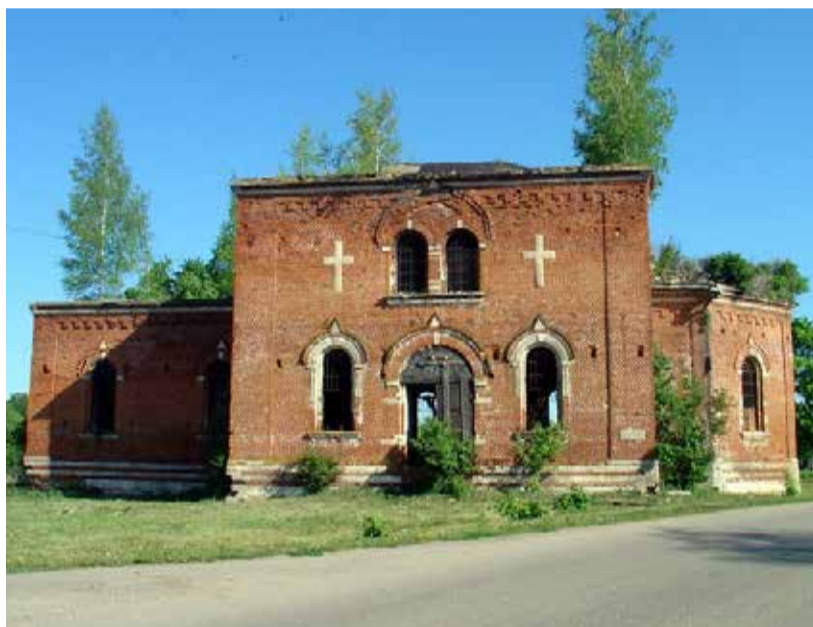
Иоанно-Богословский храм с. Богослово. 2010 г.

пожертвованы протоиереем Андреевского собора в Кронштадте Иваном Ильичем Сергиевым, ныне известным как св.