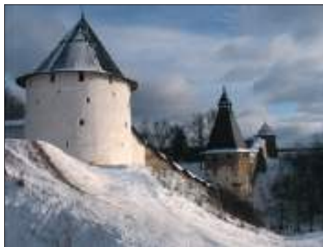
Псково-Печерский монастырь (основан в 1473 г.)

Сейчас я пытаюсь вспомнить и передать словами свои ощущения именно от этой поездки. Так уж получилось, что они оказались глубже и ярче, чем впечатления от более поздних поездок сюда или в другие монастыри.