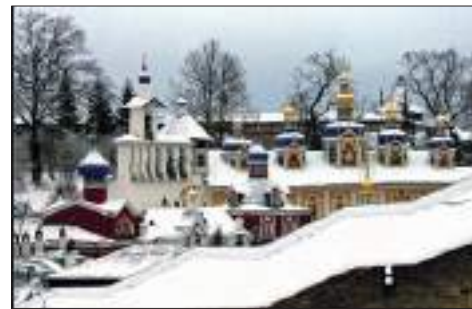
Псково-Печерский монастырь. Звонница и храмы

Первое – это монастырские службы. Полумрак, горят только свечи, тихое строгое мужское пение, бородачи-монахи стоят, не шелохнувшись, как изваяния из черного дерева. Другие, в развевающихся при ходьбе мантиях, то там, то здесь мелькают, как тени усопших.