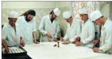
Просфорня – одно из самых ответственных послушаний

Но самое приятное, хотя и тяжелое, послушание было в просфорне. Одели нас во все белое и предупредили: никаких разговоров. Поначалу поставили читать Псалтирь, хотя из-за технического гула почти ничего не было слышно. Потом заставили мять тесто, катать лепешки, нарезать кружочки из теста, ставить печати. Вроде бы ничего сложного, и делаешь все правильно, а как достают противень из печи... Святые угодники! Все просфорки перекособочились, расплзлись, слиплись. Жарко так, что пот в три ручья, а старшие просфорники еще жару добавляют «братскими наставлениями». Но в обилии просфорного брака есть свои плюсы – мы вдоволь наелись вкуснейших горячих пышек.