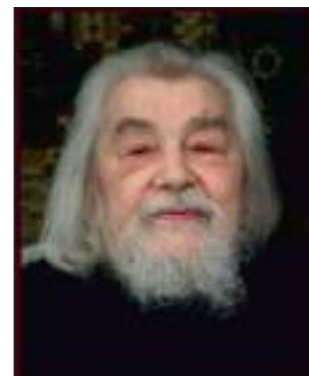
Архимандрит Иоанн (Крестьянкин)