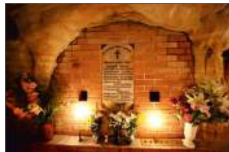
Братское захоронение в погребальных пещерах

А еще я слышал от гида-монаха, который сопровождал паломников в пещеры, что ученые заинтересовались этим феноменом, но ничего объяснить так и не смогли. Стены и своды в этих пещерах из плотного песка, даже не окаменевшего, ногтем поскребешь – он и сыплется. А по природе он то ли кварцевый, то ли кремниевый (точно не помню), но именно такой, который должен, по законам физики, отталкивать запах, а не поглощать его. Здесь же все наоборот. Парадокс!