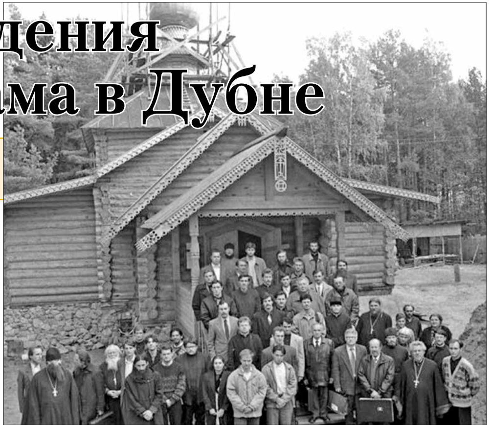
Смоленский храм, Дубна, участники конференции ОИЯИ, 9 сентября 1999 г.

В Радоницу на поляне перед старым районным кладбищем была отслужена панихида. День был весенним, майским, солнечным, вокруг сосны – красота! Тут-то и пришла мысль построить храм именно на этом месте – в чудном бору недалеко от жилого массива.