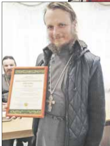
кратный духовный выбор и этим опытом выбора может поделиться. Батюшка предостерег от фор-

На заседании подвели итоги деятельности в прошедшем учебном году, выработали план работы горно и благочиния на предстоящий учебный год, обсудили перечень мероприятий в рамках XX Московских областных Рождественских образовательных чтений «Глобальные вызовы современности и духовный выбор человека». Особое внимание собрание уделило возможности разработки и воплощения совместных социально значимых проектов.