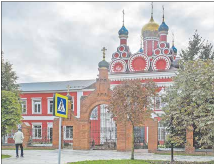
Храм Архангела Михаила, октябрь 2022 года

По материалам брошюры «Храм Архангела Михаила в Талдоме»