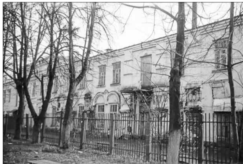
Храм Архангела Михаила. Фото 1989 года

В последующие годы наблюдалось постоянное желание прихожан к улучшению своего храма. В январе 1812 г. заменили деревянную крышу на железную. В 1817 г. оштукатурили церковь снаружи. В июне 1820 г. прихожане «возымали намерение