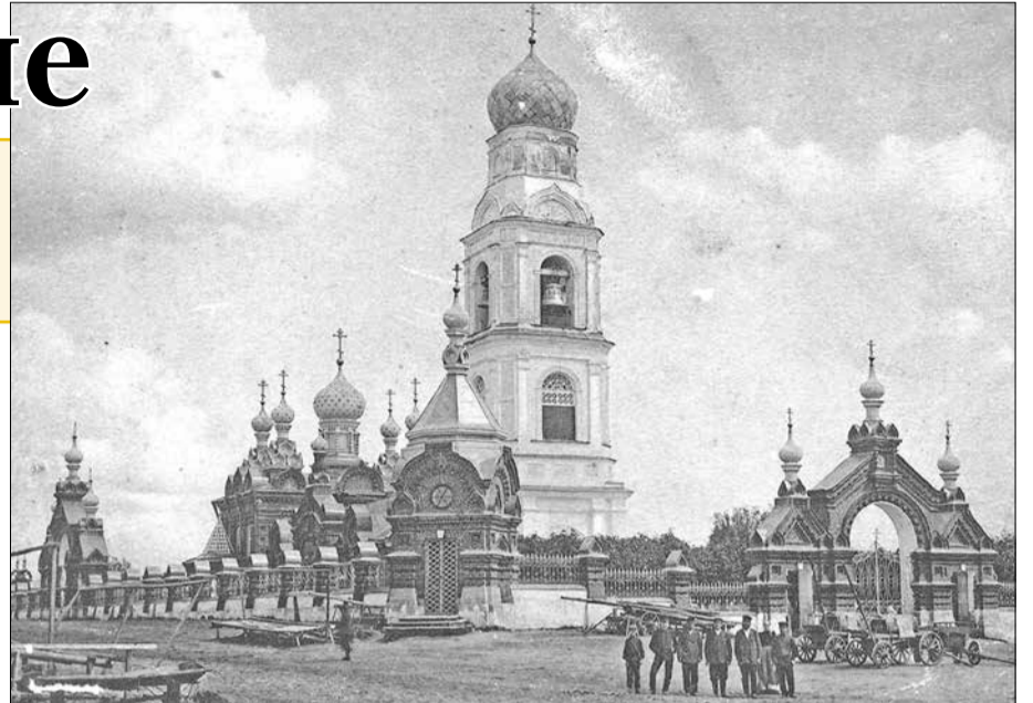
Храм Архангела Михаила. Открытка начала 20 века