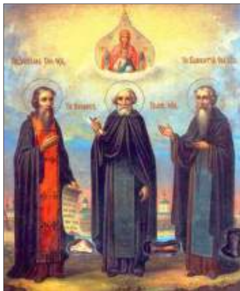
Преп. Зосима, Савватий и Герман

Примерно через полтора столетия после того, как на Соловецком архипелаге зазвучала молитва первых отшельников, обитель превратилась в столицу Западного Беломорья – религиозный, админи-