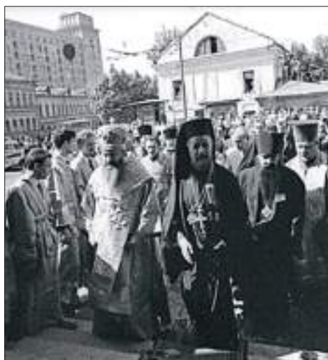
Патриарх Пимен (Извеков) и Архиепископ Макариос (Мускос), 3 июня 1971 г.

Во время нашего пребывания в Загорске произошло событие мирового масштаба. В Москву с официальным визитом на интронизацию Патриарха Пимена прибыл президент Кипра, а равно и глава Кипрской Церкви – Архиепископ Макариос III*. Это было главной новостью, которую без конца повторяли по радио и телевидению. После посещения столицы по протоколу была намечена его поездка в Троице-Сергиеву Лавру со вновь избранным Патриархом.