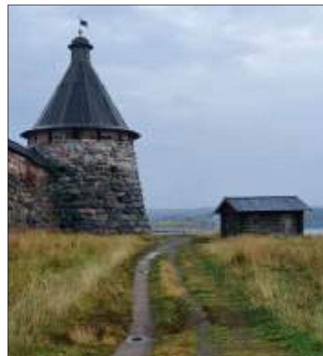
Белая башня (1584-1598 гг.)

Почти полгода архипелаг покрывают дрейфующие льды, однако, когда море освобождается от них, можно видеть тюленей и белух, любоваться восходами и закатами, наблюдать приливы и отливы.