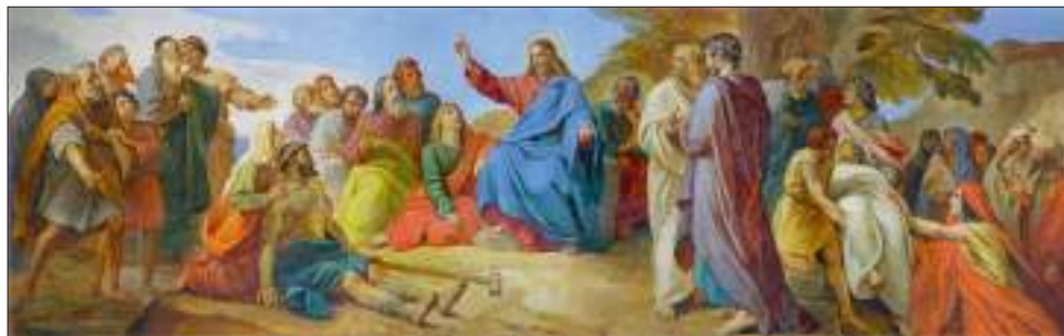
П.Басин. Нагорная проповедь

стве – в наших группах ВКонтакте и в Телеграме. Правда, в ВКонтакте почему-то никто даже и не попытался ответить на вопросы, а в Телеграм-версии викторины участвовало около 15 человек.