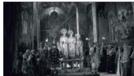
Пещное действо. Кадр из фильма С.Эйзенштейна «Иван Грозный»

Этот обряд был запрещен еще Петром I. Но увидеть его реконструкцию мы можем и сегодня – сцена Пещного действия в Успенском соборе вошла в фильм Сергея Эйзенштейна «Иван Грозный».