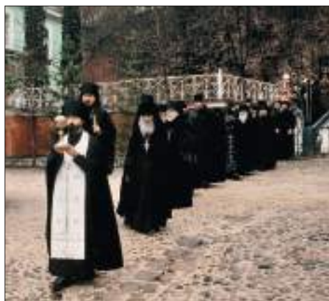
Чин о панагии в Псково-Печерском монастыре

Когда апостолы чудесным образом собрались в Иерусалиме на погребение Божией Матери и вознесли, было, за трапезой хлеб со словами «Велико имя...», в этот момент они увидели на воздухе Пресвятую Богородицу, окруженную Ангелами. Обрадованные ученики Христовы от неожиданности воскликнули вместо «Господи Иисусе Христе, помогай нам» – «Пресвятая Богородице, помогай нам». После этого апостолы отправились ко гробу Богоматери и не обрели Ее пречистого тела, и тогда они поняли, что Она вознеслась к Своему Божественному Сыну. Это предание получило письменное закрепление в книге Четьи-Минеи на праздник Успения Пресвятой Богородицы.