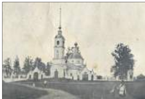
Усадьба Спас-Угол. Акварель Афанасьева, нач. 1900-х гг.

19 августа Православная Церковь отмечает один из самых известных праздников – Преображение Господне, или Яблочный Спас, как принято называть его в народе. Много храмов на Руси было построено в честь этого праздника, на Талдомской земле известен старинный Преображенский храм в селе Спас-Угол.