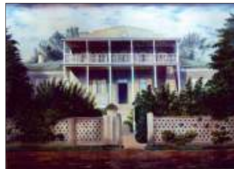
Храм Преображения, фото нач. XX века

но дарили детям в этот праздник по гривеннику, которые они могли потратить на торге у храма.