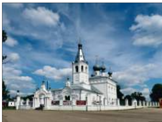
Храм в Годеново

В воскресенье, 14 августа, в день праздника Происхождения (изнесения) Честных Древ Животворящего Креста Господня паломники из Дубны посетили храм во имя Святителя Иоанна Златоуста в селе Годеново Ярославской митрополии. В этом храме хранится великая святыня православия – Небоявленный Крест Господень. В этот день совершается престольный праздник храма. В следующем году будет отмечаться 600-летие явления Креста пастухам на болоте, неподалеку от Годеново. За почти шесть веков Крест отмечен неисчислимым количеством чудотворений. По молитвам перед ним исцелились за эти века буквально тысячи людей.