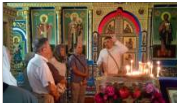
В монастыре Животворящего Креста Господня

стройный, красивый пятиглавый барочный храм. В 1810 году к нему была пристроена колокольня в стиле классицизма. В церкви четыре придела: в честь Собора архистратига Михаила и в честь святителей Митрофана Воронежского, Николая Чудотворца и Димитрия Ростовского. Даже в советское время здесь совершалось регулярное богослужение. Церковь сохранила свое внутреннее убранство, и в ней особая атмосфера. Особенно хорош иконостас, имеющий вид триумфальной арки. Поражает его легкость, предельная декоративность каждой детали – от изящных колонок классических портиков до воздушных гирлянд, перекинутых над резными царскими вратами и как бы раздвигающих пространство храма. Восторженным восклицаниям и вздохам восхищения всем увиденным не было конца. Хотелось смотреть и рассматривать каждый завиток, каждую фреску, каждую деталь богатого убранства. В заключение нашей экскурсии мы поднялись на колокольню, откуда открывается замечательная панорама: вид на лежащие неподалеку Ростов Великий и озеро Неро.