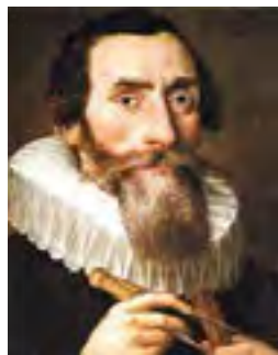
Иоганн Кеплер (1571–1630),

Ферма, Лейбниц, Паскаль, Гримальди, Эйлер и другие; как все великие астрономы, физики и математики прошлых веков».