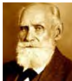
Павлов И. П. (1849–1936),

у нас есть душа, что ее нет; что мир сотворен, что он нерукотворен...»