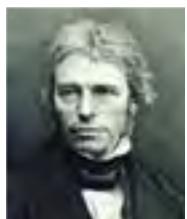
Майкл Фарадей (1791–1867),

удивляемся Ему по причине Его совершенства, почитаем Его и преклоняемся пред Ним по причине Его беспредельной власти. Из слепой физической необходимости, которая всегда и везде одинакова, не могло бы произойти никакого разнообразия; и все соответственное месту и времени разнообразно сотворенных предметов, что и составляет строй и жизнь Вселенной, могло произойти только по мысли и воле Существа самобытного, Которое я и называю Господом Богом».