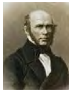
Пирогов Н. И. (1810–1881),

и знаю, что все человеческие чувства...связаны, каждое из них, с особой клеткой человеческого мозга и ее нервами. А когда тело перестает жить, тогда все эти чувства и мысли человека, как бы оторвавшись от мозговых клеток, уже умерших, в силу общего закона о том, что ничто – ни энергия, ни материя – не исчезает бесследно, и составляют ту душу, бессмертную душу, которую исповедует христианская вера».