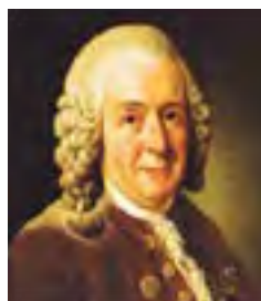
Карл Линней (1707–1778),

фундамент классической механики. «Священное Писание никогда не может лгать или заблуждаться. Его высказывания абсолютно правильны и невредимы. Само оно не может заблуждаться, только его толкователи могут в различной степени заблуждаться... Священное Писание и природа, оба исходят из Божественного Слова, то – как повеление Святого Духа, другая – как исполнитель Божиих повелений».