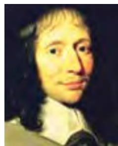
Блез Паскаль (1623–1662),

от Бога, и кто от Бога, тот слушается ее голоса.» «Почему люди предпочитают блуждать в неизвестности по многим важным вопросам, когда Бог подарил им такую чудную Книгу Откровения? и другие».