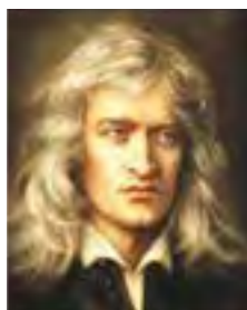
Исаак Ньютон (1643–1727),

«В сравнении с Библией все человеческие книги являются малыми планетами, которые свой свет и блеск получают от Солнца. Не наше дело предписывать Богу, как ему следует управлять этим миром».