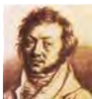
Андре Мари Ампер (1775–1836),

ни о чем». «О, как счастлив тот, кому дано через науку возвышаться до Небес. Там видит он превыше всего творчество Божие!»