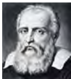
Галилео Галилей (1564–1642),

Куда бы мы ни обращали наши взоры, каким бы ни был предмет нашего наблюдения, мы нигде не находим противоречия между наукой и религией. Мы, скорее, констатируем их абсолютную гармонию в основных пунктах, особенно в области естествознания. Как религия, так и наука, в конечном результате, ищут истину и приходят к исповеданию Бога. Небеса свидетельствуют о силе Бога. Сейчас ученые утверждают, что Вселенная не просто расширяется, она расширяется с ускорением! Когда вы в следующий раз будете смотреть на ночное небо, задумайтесь: «Кто источник энергии, благодаря которой возможно расширение и ускорение Вселенной?» Библия говорит, что у Творца – «изобилие... мощи и энергии». Божии творения свидетельствуют о том, что Он – Всемогущий Творец, и наука это подтверждает.