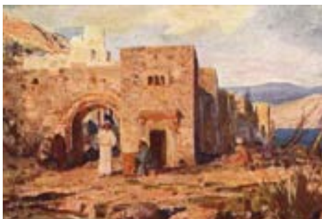
В.Д. Поленов. Левий (Матфей)

– автор первого Евангелия. До встречи с Христом был мытарем – сборщиком налогов, но последовал за Учителем буквально во время