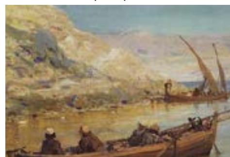
В.Д. Поленов. Иаков и Иоанн

– рыбак с Галилейского моря, брат евангелиста Иоанна. Зовется также Старшим, поскольку среди апостолов есть еще один Иаков – Меньший. Вместе с братом Иоанном и апостолом Петром был свидетелем Преображения Господа