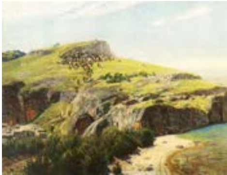
В.Д. Поленов. Он учил

– родом из Каны Галилейской. О нем Иисус сказал, что он – иудей, в котором нет лукавства.