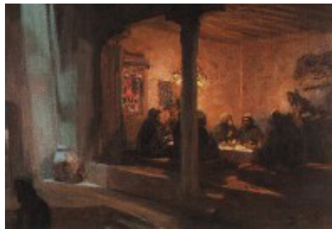
В.Д. Поленов. Тайная вечеря

– предатель и вор. Впоследствии, на Апостольском соборе, его место согласно жребию занял апостол Матфий.