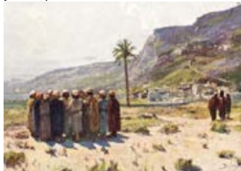
В.Д. Поленов. Наставление ученикам

С именами двенадцати Апостолов иногда бывает путаница даже у воцерковленных людей. Запомнить