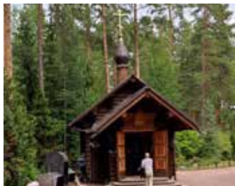
Часовня батюшки Серафима в Вырице

Затем мы приложились к мощам преподобного Серафима, а отец Павел помазал нас освященным маслом.