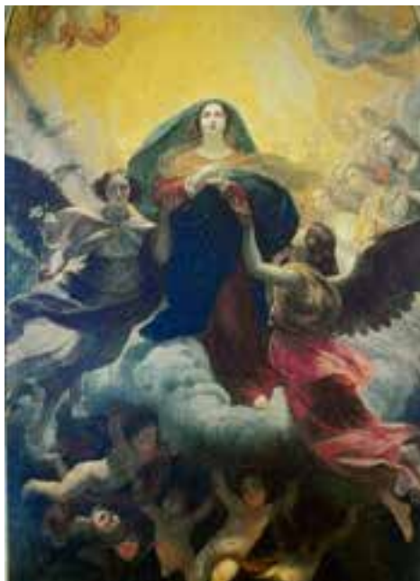
Карл Брюллов. Взятие Богоматери на небо

В V веке святитель Ювеналий, Патриарх Иерусалимский, говорил святой благоверной греческой ца-