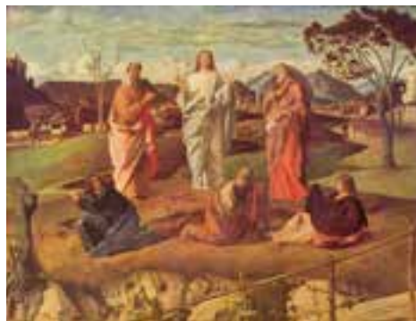
Джованни Беллини. Преображение Господне

трех Евангелиях: от Матфея (17:1-6), Марка (9:1-8), Луки (9:28-36). Незадолго до Своего страдания Христос взял троих апостолов – Петра, Иакова и Иоанна – на гору в Галилее (по преданию, на гору Фавор), где, молясь, преобразился: одежда и лицо Его просияли белым светом. Возле Христа стояли пророки Моисей и Илия и беседовали с Ним. В неизреченной радости апостол Петр простосердечно обратился ко Господу: «Господи! хорошо нам здесь быть; если хочешь, сделаем три кущи: Тебе одну, и Моисею одну, и одну Илию». В этот момент апостолов осеняет светлое облако, из которого раздается глас Божий: «Сей есть Сын Мой Возлюбленный, в Котором Мое благоволение; Его слушайте».