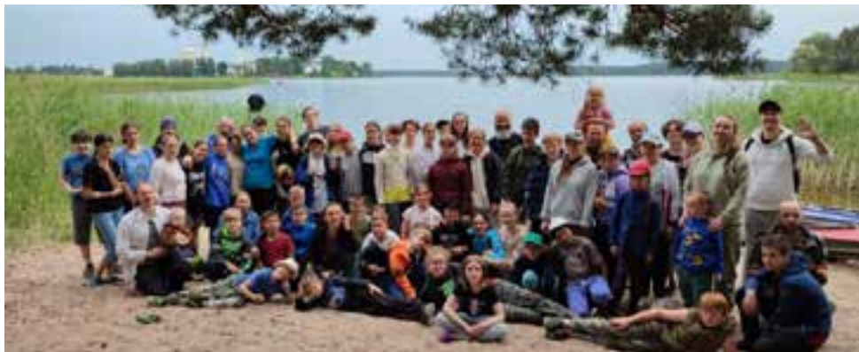
С друзьями из Москвы

Следующие дни были получше, по крайней мере, не было града, зато пришли они: единственные и неповторимые, старые как мир и нужные как воздух, любимые всеми – грядки! Да-да, именно они. Земля была мокрой, как и сорняки, и все наши девушки, копаясь в земле, тихо завидовали мальчикам. Мальчики таскали камни и, отмывая колокольню от голубиных следов, тихо (а, может, и громко) завидовали нам. Все думали, что у других работа лучше. Кстати, я бы и правда лучше бы