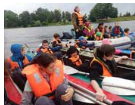
Водный крестный ход

Вначале ничто не предвещало беды. Погода была с переменной облачностью, мы переправили вещи, кто-то уже поставил палатки, кто-то только разгружался. Как вдруг... упала капля... первая, вторая – и начался ужасающий ливень, который, ожесточаясь, превратился в бомбардировку сильнейшим градом (а дело было в июне)! Последствия были самые ужасные: вещи промокли, люди промокли, радость и надежда про-