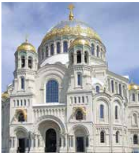
Морской собор в Кронштадте