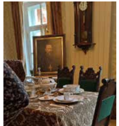
Музей-квартира Иоанна Кронштадтского

Преподобный Серафим Вырицкий – человек удивительный, а его пророчества поражают своим исполнением. Это человек настолько неве-