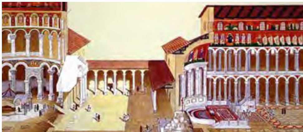
Церковный комплекс на Святых местах Иерусалима в IV веке (реконструкция)

Когда были обнаружены Голгофа, пещера Гроба Господня и прочее, на императорские средства там был