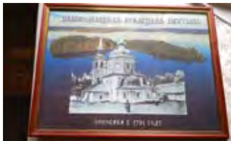
Новосоловецкая Вселуцкая пустынь до революции