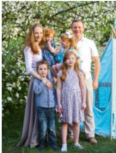
Вот оно счастье!!!

Но необходимость пребывания с детьми важна не только в раннем возрасте.