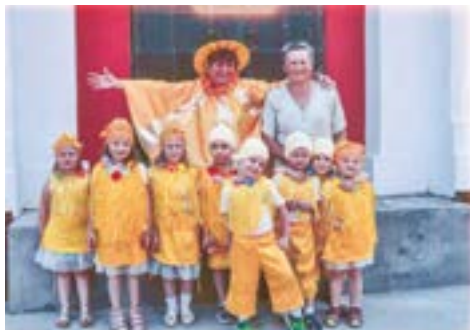
С детьми из воскресной школы