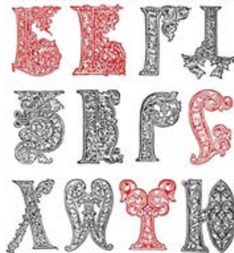
Буквицы из Апостола

Для оформления книги были использованы 40 заставок и 22 буквы. Орнаментность букв имеет символический смысл. Часто буквы представляли собой маленькие притчи.