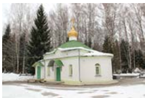
Храм прп. Даниила Переяславского в Дубне

20 апреля в Дубне отмечается сразу два престольных праздника: в храме Похвалы Пресвятой Богородицы в Ратмино и храме преподобного Даниила Переяславского на Большеволжском кладбище г. Дубны. Однако, такое совпадение происходит крайне редко. В 21 веке оно происходит всего 4 раза – в 2002 г., 2013 г., 2024 и в 2097 г. Связано это с тем, что память прп. Даниила имеет чётко установленный день – 20 апреля, а вот торжество Похвалы Пресвятой Богородицы напрямую зависит от празднования Пасхи и является днём переходящим.