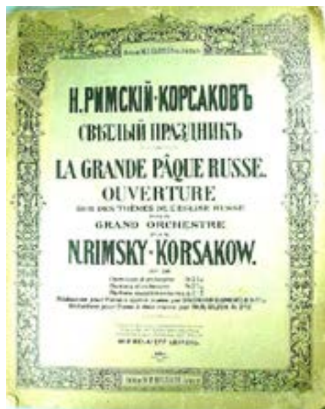
Обложка партитуры увертюры

Относительно точного времени сочинения увертюры «Светлый праздник» ор. 36 (Воскресная увертюра на темы из Обихода) есть неясности: сам композитор пишет, что окончил ее летом 1888 г. Однако на рукописи стоят странные даты: «Начато 25 июля, конч. 20 марта (?) 1888 г.» По-видимому, дата окончания указана ошибочно, так как и по номеру опуса и по постоянному упоминанию после «Шехеразады», это сочинение было следующим, т.е. написанным после 26 июля 1888 года, когда была закончена сюита.