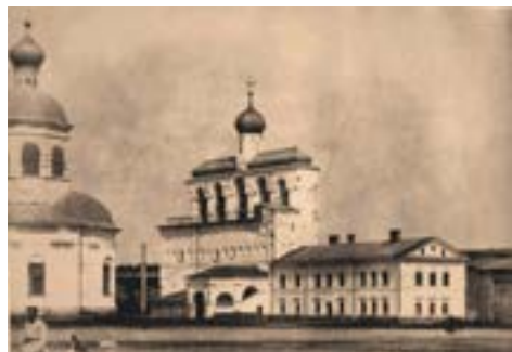
Новгород. Звонница Софийского собора. 1895-1916 гг.

В своих воспоминаниях Сергей Васильевич писал: «Одно из самых дорогих воспоминаний детства связано с четырьмя нотами, вызывающимися колоколами Новгородского Софийского собора...