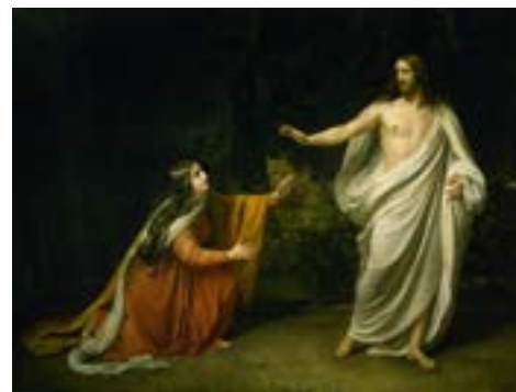
Явление Христа Марии Магдалене. Александр Иванов

После того как апостолы ушли, у гроба осталась плачущая Мария Магдалина. Ей являются два ангела, а потом и Христос, которого она сперва приняла за садовника.