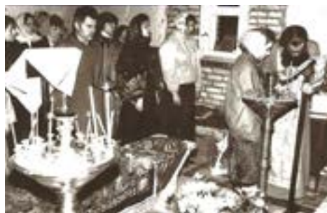
Пасха в храме прп. Даниила 1994 г.

Многим из сторожил храма особенно запомнилась Пасха 1994 года.