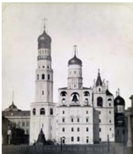
Вид на колокольню Ивана Великого. Дореволюционное фото

Именно такой эпиграф разместил Сергей Рахманинов к завершающей части своей фортепианной сюиты, которая носит название "Светлый праздник". Два рояля словно превращаются в перезвоны колокольной – настолько достоверно они передают радостный гимн Пасхального торжества Христова Воскресения!