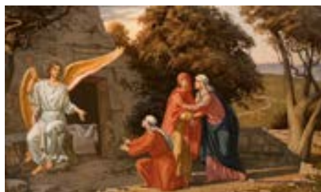
Явление Ангела женам-мироносицам

В первый день после субботы (ныне этот день называется Воскресение) – после субботнего покоя ко гробу идут жёны-мироносицы.