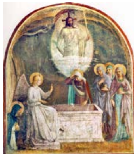
Фра Беато Анжелико. Воскресение

Вторая – начало XVI главы Евангелия от Марка: «По прошествии Субботы, Мария Магдалина и Мария Иаковлева и Саломия купили ароматы, чтобы идти – помазать Его. И весьма рано, в первый день недели, приходят ко гробу, при восходе солнца, и говорят между собою: «Кто отвалит нам камень от двери гроба?» И взглянувши видят, что камень отвален; а он был весьма велик. И вошедши во гроб, увидели юношу, сидящего на правой стороне, облеченного в белую одежду, и ужаснулись. Он же говорит им: «Не ужасайтесь. Иисуса ищите Назарянина распятого; Он воскрес.»