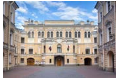
Придворная певческая капелла в Санкт - Петербурге

Несомненно, идея увертюры на обиходные темы связана с деятельностью Римского-Корсакова в Придворной певческой капелле: только обширный, каждодневный слуховой опыт в сочетании с детскими впечатлениями мог привести