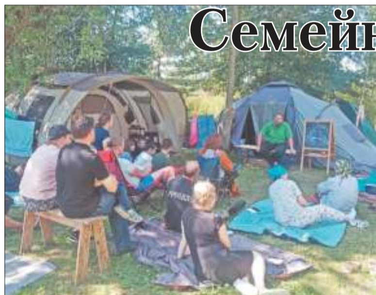
Фото участников лагеря

Семейный лагерь «Глебово» оставил добрые впечатления в сердцах отдыхающих. «Хочется выразить благодарность всем причастным к организации этого прекрасного лагеря. Приедем ещё обязательно!» - написала одна из участниц.