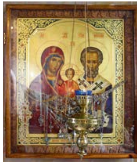
Чудотворный список Оковецкой иконы Божией Матери в Оковецком Спасо-Преображенском скиту

26 мая 1539 года, в день Сошествия Святого Духа, в Тверской епархии, на Вырышенском городище, находившемся среди дремучего леса на берегу речки Вырышни в Оковецкой волости, недалеко от города Ржева иноком Стефаном при стечении народа из четырех окрестных деревень были обретены: прибитый к сосне большой железный крест и на другом дереве – небольшая, старого письма, икона, изображавшая Божию Матерь с Младенцем и с предстоящим святителем Николаем Мирликийским, Чудотворцем. При явлении святого креста и иконы воссиял необычный свет