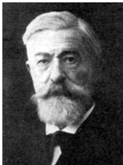
Иоаннес Юлий Шубринг (1839–1914)

в соборе св. Павла в Лейпциге. Хор состоял более чем из 300 человек