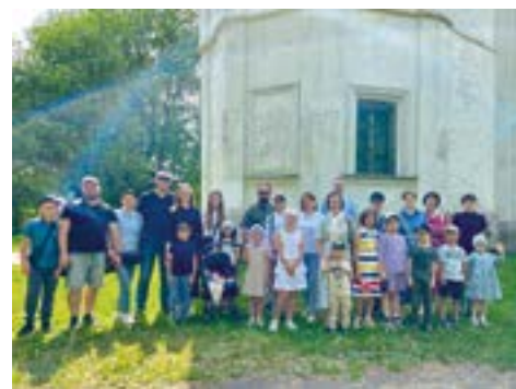
Паломническая группа храма п. Северный в Кашине