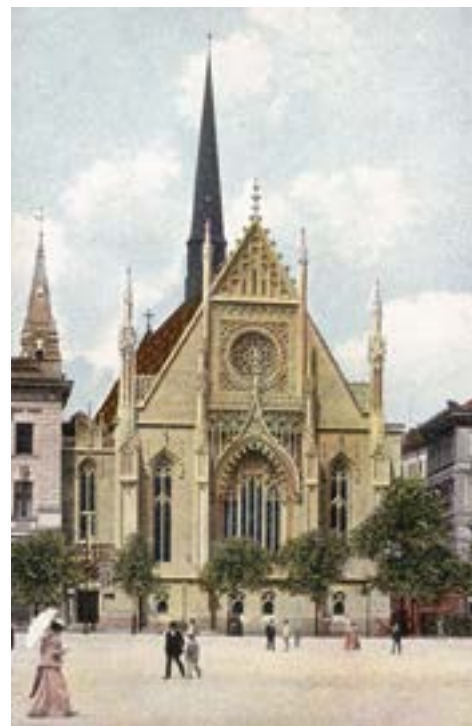
Собор св. Павла в Лейпциге

называл его "мой единственный настоящий друг, мой учитель в искусстве и жизни". Композитор продемонстрировал несколько отрывков из "Павла" отцу в начале лета 1834 и вызвал большой интерес Авраама к этой работе. В марте 1835 года, отвечая отцу на большое аналитическое письмо, Феликс писал: "... я часто теряюсь, пытаюсь понять, как вы, не имея технической подготовки в музыке, можете иметь такие пронзительные музыкальные оценки." Он добавил, что после "одного очень несовершенного звучания" Авраам указал на недостатки, которые он сам пропускал несколько месяцев. И поэтому, когда Авраам скоропостижно скончался в ноябре 1835 года, на Феликса эта утрата наложила ответственность исполнить невыполненные желания отца, в том