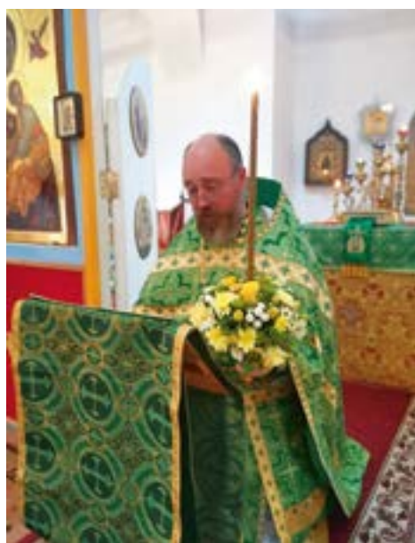
Чтение коленопреклонных молитв в храме вмч. Пантелеимона г. Дубны

духовенство и прихожане поздравили награждённую с заслуженной наградой.