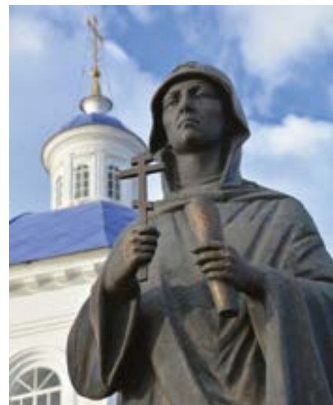
Памятник Анне Кашинской в г. Кашине