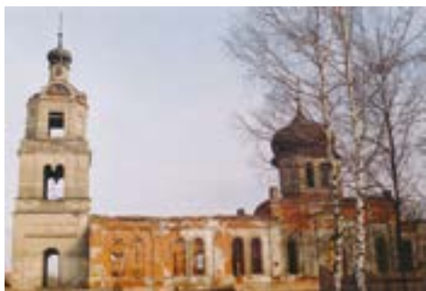
Казанский храм до реставрации

Церковь приходская, построена на средства экономических прихожан в 1847–1858 гг. в стиле эклектики. Кирпичная, оштукатуренная. Композиция трёхчастная осевая. Четверик церкви увенчан крупным восьмигранным барабаном под луковичным куполом, опирающимся на внутренние колонны. С востока к нему примыкает прямоугольный алтарь, с запада трапезная с двумя приделами и трёхъярусная колокольня, увенчанная луковичным куполом. В декоре преимущественно используются элементы русско-византийского стиля. Главный престол Казанский, в трапезной Георгиевский (справа) и Никольский (слева).