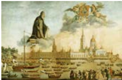
Посещение Александром I Ниловой пустыни

По кончине преподобного Нила близ его могилы на острове стали селиться отшельники-молитвенники, ими и был основан монастырь. До революции 1917 года Нило-Столобенский монастырь был в числе самых почитаемых в России, ежегодно сюда приезжали тысячи людей. В 1820 году обитель посетил император Александр I. В 1858 году вокруг острова соорудили гранитную набережную.