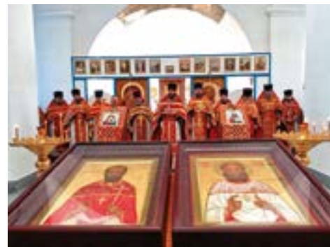
Соборная благочинническая служба в день памяти Талдомских новомучеников 10.12.2021 г.