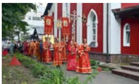
Крестный ход вокруг Пантелеимоновского храма

В завершение богослужения была прочитана молитва великомученику и целителю Пантелеимону.