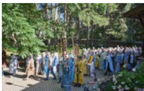
Престольный праздник в храме Смоленской иконы Божией Матери г. Дубны

благочиния прошли богослужения в честь Происхождения (Изнесения) Честных Древ Животворящего Креста Господня. Накануне праздника были совершены вечерние службы, а 14 августа – Божественные литургии.