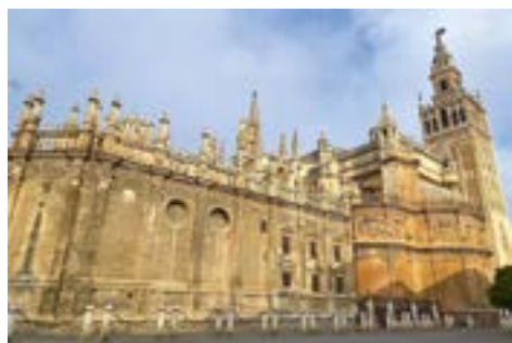
Севильский кафедральный собор (Санта-Мария-де-ла-Седе)

При этом все изображения Богоматери, принадлежащие его кисти, имеют общие черты – какую-то неуловимую схожесть в разрезе глаз, очертаниях носа и лба. Внимательно вглядываясь в эти лики, мы обнаруживаем, что Богоматерь Мурильо – всегда уроженка Андалусии.