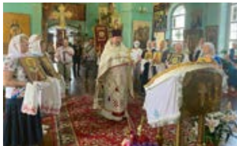
Престольный праздник в Преображенском храме с. Квашёнки