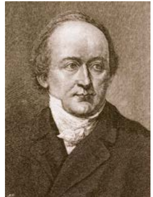
Христиан фон Бунзен

Несмотря на большую заинтересованность Мендельсона, работа над либретто не продвинулась вплоть до 1844 года, когда он обратился за помощью к прусскому ученому и дипломату Христиану фон Бунзену. В апреле 1844 года Бунзен прислал композитору свое либретто, основанное на фрагментах из Священного Писания. Именно этот текст с некоторыми авторскими переработками и был положен Мендельсоном на музыку, став основой того произведения, которое сейчас известно под названием «Христос».