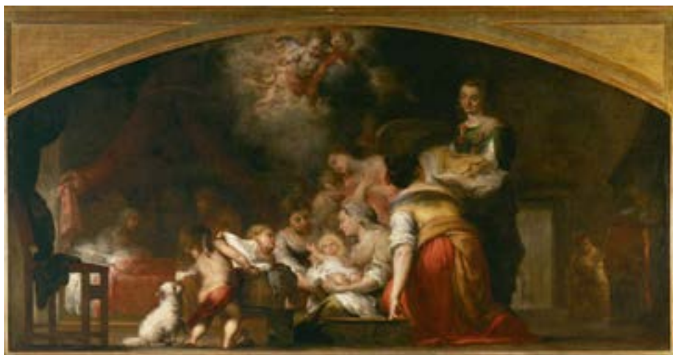
«Рождество Богородицы» Бартоломе Эстебаном Мурильо

Это одно из наиболее значительных произведений в творчестве Мурильо. В её основе лежат особенности повседневной жизни Андалусии того времени. С 1650-х гг. Мурильо насыщает свои работы золотистой светотенью, переходя к более живописной манере (особенно в пейзажных фонах). Мурильо создаёт религиозные композиции, в том числе сцены из жизни Богоматери, с проникновенным лиризмом передающие национальный тип испанской женщины.