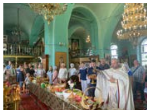
Освящение плодов в Преображенском храме в с. Квашёнки