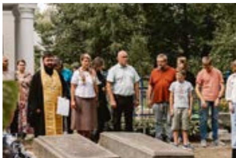
Лития на фамильном некрополе семейства Салтыковых