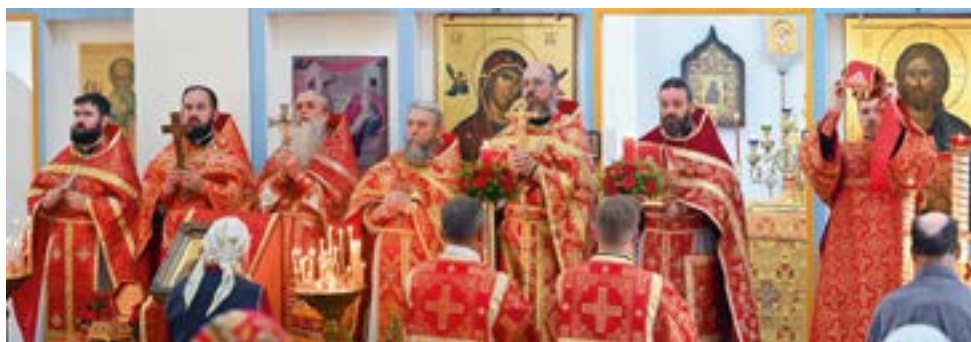
Престольный праздник в Пантелеимоновском храме

После Литургии была освящена написанная к престольному празднику икона святого Пантелеимона для иконостаса храма. После этого состоялся традиционный крестный ход, во время которого духовенство окропляло народ святой водой, за Алтарем было прочитано Евангелие.