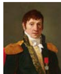
Николя Жан де Дьё Сульта

Первоначально французы намеревались забрать его же картину «Видение святого Антония Падуанского», но городской совет предложил обменять её на «Рождество Богородицы», в результате чего она была отдана французам, а «Видение св. Антония Падуанского» осталась в часовне святого Антуана. В 1813 году оказалась в Париже в коллекции Сульта. С 1858 года картина находится в Лувре.