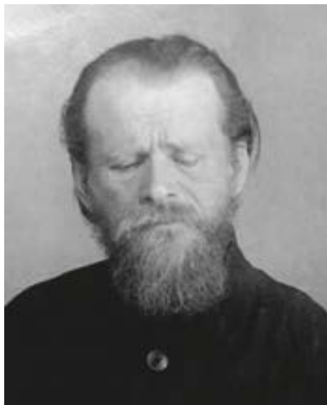
сщмч. Владимир. Тюремная фотография, 1935 г.

1 сентября 1937 г. был арестован в лагере в ходе следствия по групповому делу еп. сщмч. Дамаскина (Цедрика), обвинен в том, что «будучи заключенным и отбывая наказание в Карлаге НКВД... про-