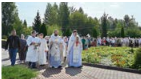
Престольный праздник в Преображенском храме пос. Запрудня