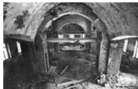
Интерьер храма до реставрации 1980 г.

Внутри храм представлял печальное зрелище: штукатурка со стен обвалилась, вместо пола волнами расстился сухой песок с осколками кирпича и щебня, ноги тонули в нем по щиколотку, как в пустыне. Мерзость разрухи внутри храма контрастировала с внешним благолепием и золотыми крестами.