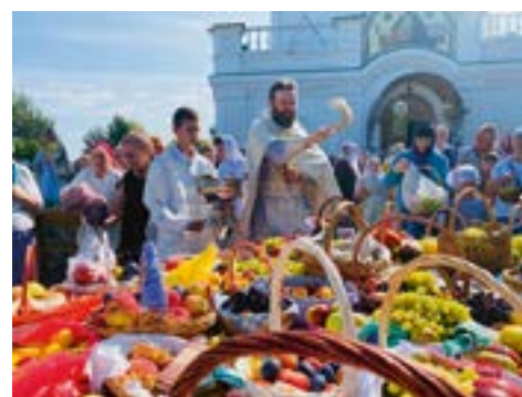
Освящение плодов в Преображенском храме пос. Запрудня