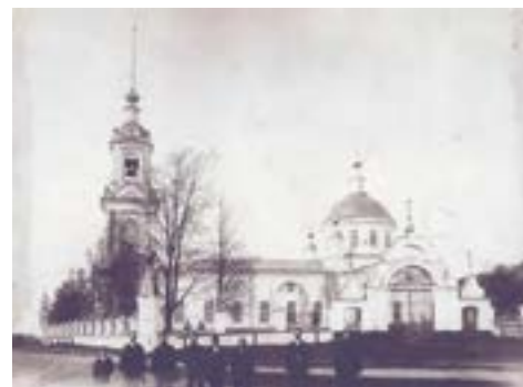
Церковь Преображения Господня с. Квашёнки до 1917 г.

главлял церковный хор в Преображенском храме села Квашенки с середины 1912 до 1916 гг.