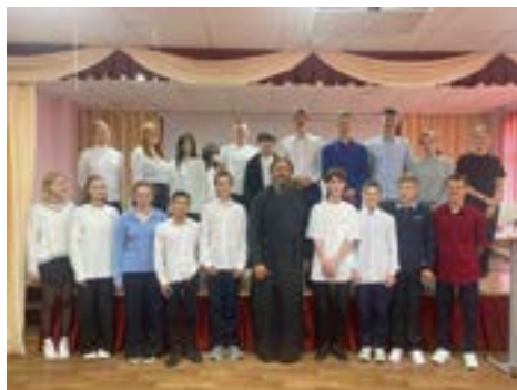
Урок трезвости в Квашёнковской СОШ