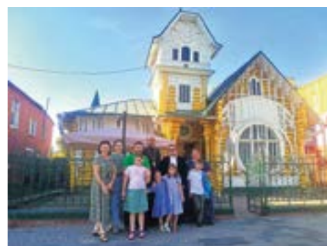
Группа прихожан Пантелеимоновского храма в г. Кимры