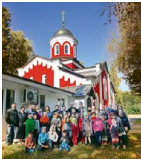
Экскурсия в храме вмч. Пантелеимона

22 сентября 2024 года воскресные школы города Дубны посетили храм великомученика и целителя Пантелеимона.