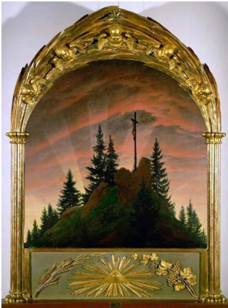
Каспар Давид Фридрих. Картина «Крест в горах» («Теченский алтарь»), 1808 г.

По другим сведениям, многочисленные эскизы и этюды свидетельствуют, что Фридрих задумал полноформатную картину маслом гораздо раньше.