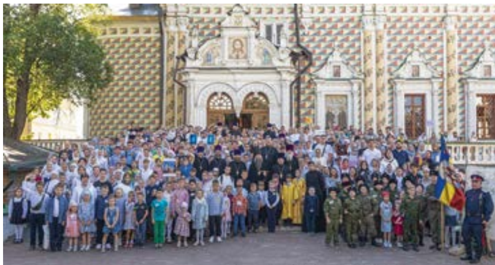
После Божественной литургии в Лавре

В завершение богослужения Владыка вознес молитву на начало нового учебного года, после чего для детей провели экскурсию по Лавре. Они приложились к мощам преподобного Сергия Радонежского, а перед отъездом для них были организованы праздничная трапеза и игры на Красногорской площади. Каждому юному паломнику епископ Кирилл преподнес памятный подарок.