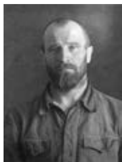
сщмч. Афанасий. Тюремное фото