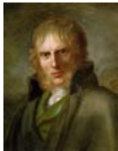
Каспар Давид Фридрих

Каспар Давид Фридрих – немецкий художник последней трети XVIII – начала XIX веков, 250-летие которого отмечается в этом году, своими смелыми, новаторскими идеями вызвавший много споров среди критиков и любителей искусства. Являлся одним из основоположников романтического