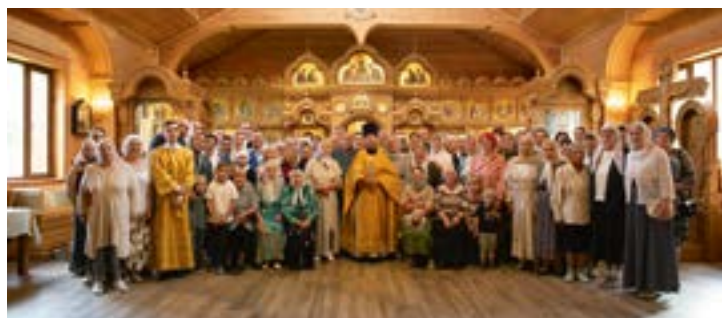
Престольный праздник в Александро-Невском храме п. Вербилки

12 СЕНТЯБРЯ 2024 ГОДА В ДЕНЬ ПАМЯТИ СЯГОГО БЛАГОВЕРНОГО КНЯЗЯ АЛЕКСАНДРА НЕВСКОГО В АЛЕКСАНДРО-НЕВСКОМ ХРАМЕ ПОСЁЛКА ВЕРБИЛКИ С ОСОБОЙ ТОРЖЕСТВЕННОСТЬЮ И ГЛУБОКОЙ ДУХОВНОЙ РАДОСТЬЮ ОТМЕТИЛИ ПРЕСТОЛЬНЫЙ ПРАЗДНИК