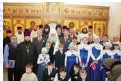
Совместное фото после Божественной литургии и Великого освящения

Обряд освящения храма по христианскому канону также носит название обновление храма – «потому что чрез освящение храм из обык-