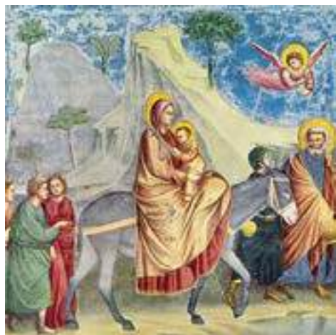
Фреска «Бегство в Египет» Джотто ди Бондоне... (капелла Скровеньи, г. Падуя)

Главные персонажи в этой сцене – Дева Мария, едущая на осле, младенец, которого она держит на руках, и Иосиф, как правило, ведущий осла. Обычно процессия на картине движется – это следует подчеркнуть – слева направо. Так эту историю изображают Джотто, монограммист А.В., Дюрер, Бассано. Кстати, последний сознательно придал своей композиции сходство с картиной Джотто. Этому движению слева направо в бегстве в Египет противоположно движение справа налево на картинах европейских художников, изображающих возвращение из Египта.