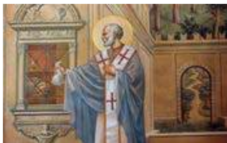
Святитель Николай подбрасывает мешок с золотом

В житии святителя Николая описывается история о том, как святой Николай помог трём девушкам, отец которых, не имея возможности собрать приданое, планировал извлечь доход из их красоты. Узнав об этом, Николай решил им помочь. Будучи скромным (или желая избавить их от унижения принятия помощи от постороннего), он бросил мешок с золотом в их дом, а сам возвратился домой.