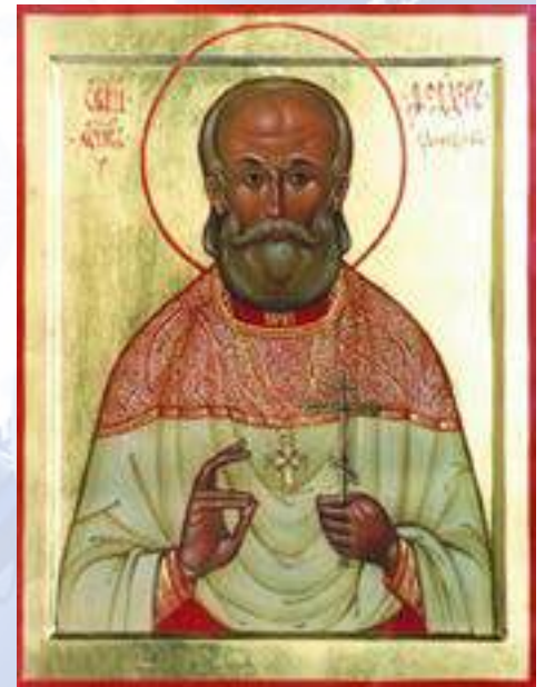
Сщм. Феодор Дорофеев

5 декабря 1937 года Тройка НКВД приговорила отца Феодора к расстрелу. Священник Феодор Дорофеев был расстрелян 10 декабря 1937 года и погребен в безвестной общей могиле на полигоне Бутово под Москвой.