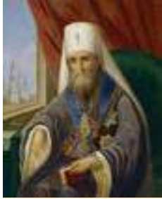
Святитель Филарет (Дроздов)

2 декабря Церковь празднует день памяти святителя Филарета (Дроздова), митрополита Московского и Коломенского. Это был выдающийся иерарх, политический деятель и ученый, первый в России доктор богословия и ректор реорганизованной Санкт-Петербургской духовной академии (1812–1819 гг.), главный инициатор перевода Библии на русский язык, член многих ученых обществ и учебных заведений, оставивший по себе богатое литературное наследие. Именно ему, как тонкому дипломату, правительство поручило составление Манифеста 19 февраля 1861 года об освобождении крестьян от крепостной зависимости. Автор «Последования благодарственного молебного пения ко Господу Богу на воспоминание избавления Церкви и Державы Российския от нашествия галлов и с ними двадцати язык» (в часть победы над Наполеоном).