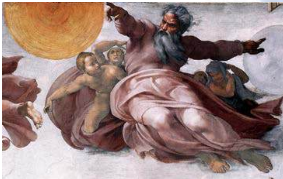
«Сотворение Солнца, Луны и планет», Микеланджело Буонарроти

Слово Христово да вселяется в вас обильно, со всякою премудростью; научайте и вразумляйте друг друга псалмами, славословием и духовными песнями, во благодати воспевая в сердцах ваших Господу (Кол. 3:16)