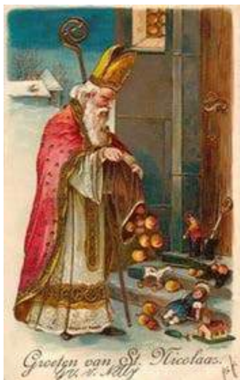
Св. Николай на рождественской открытке

Начало священного служения святителя Николая приходится на время самых жестоких и продолжительных гонений на христиан в истории Римской империи. Епископство святителя Николая в Мире (современный город Демре, провинция Анталия в Турции) приходится на период, когда гонения были прекращены.