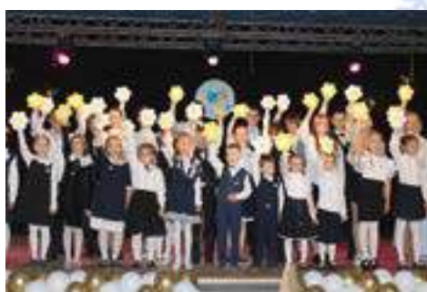
Выступление воспитанников гимназии