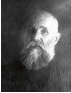
Тюремное фото о. Феодора

Священномученик Феодор родился 7 июня 1885 года в деревне Козлаково Андреевской волости Владимирской губернии, в потомственной священной семье.