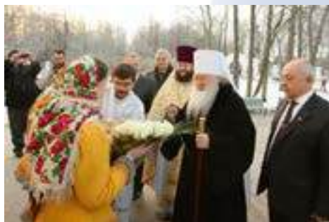
Встреча митрополита Крутицкого и Коломенского Ювеналия

У нас всё получилось. Ещё одно послушание – это получение антиминсов в Москве в епархиальном управлении. Антиминс – это плат, заключающий в себе благословение правящего архиерея на служение литургии на определённом престоле. Конечно, подготовка богослужения Великого освящения храма – это работа всего прихода и не только (хор, звонарь, уборка храма и его территории, транспорт, оповещение горожан, приглашение гостей, трапеза и многое другое).