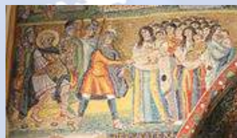
Мозаика на римской триумфальной арке Санта-Мария-Маджоре

триумфальной арке Санта-Мария-Маджоре изображает прибытие в Сотину (эпизод из апокрифического рассказа о бегстве в Египет) в качестве параллели поклонению волхвов, сопрягая таким образом два явления Христа язычникам. Апокрифические Евангелия подробно описывают его триумф.