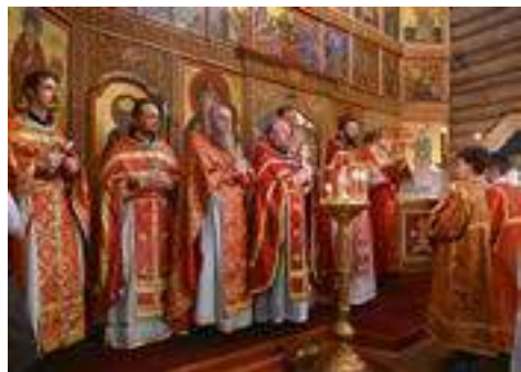
Литургия в день 30-летия православной гимназии «Одигитрия» и день памяти Михаила Дубненского (Абрамова)

29 ноября 2024 года в городе Дубна прошли торжества по случаю тридцатилетия со дня основания православной гимназии «Одигитрия». Праздничное богослужение в Смоленском храме возглавил благочинный церковью Дубненско-Талдомского округа протоиерей