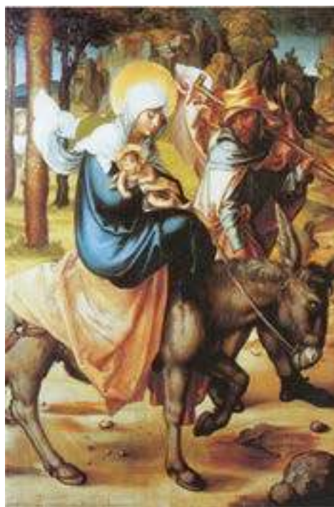
«Бегство в Египет» Альбрехта Дюрера

о том, что в Вифлееме на перепись Иосиф отправился со своими детьми от первого брака, поскольку у него было намерение: "Сыновей своих запишу". Джотто, следуя рассказу Псевдо-Матфея, изображает трех отроков. Так же поступил и Бассано. У Джотто в сцене присутствует тоже одна женщина. Согласно все тому же Псевдо-Матфею, это Саломея, повивальная бабка. В более поздней итальянской живописи, в частности у Джентиле да Фабриано, мужские фигуры в этой сцене исчезают, их заменяют две служанки. В живописи художников, живших к северу от Альп, вообще не принято было изображать кого бы то ни было из сопровождавших Святое семейство в этом путешествии, что нам и демонстрируют Альбрехт Дюрер и монограммист А.В.