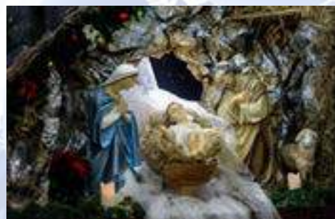
Фигурка младенца Христа в яслях

Первоначально 6 декабря, в день святого Николая по церковному календарю, в странах Европы было принято дарить детям подарки от его имени, причём подарки подкладывали ночью в чулки. Однако в период Реформации, когда не одобрялось почитание святых, в Германии и сопредельных странах персонажем, который раздаёт подарки, стал младенец Христос, а день их вручения был перенесён с 6 на 24 декабря, то есть на время рождественских ярмарок.