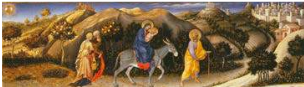
«Бегство в Египет» Джентиле да Фабриано

Такой способ изображения бегства Святого семейства в Египет, основанный на евангельском рассказе, остается постоянным на протяжении всей истории западноевропейской живописи. Однако могли вноситься различные дополнительные детали, заимствованные из апо-