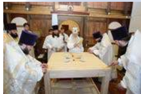
Освящение центрального престола

В конце осени была назначена дата освящения храма – 20 декабря. Это следующий день за престольным праздником Ратминского храма в честь святителя Николая.