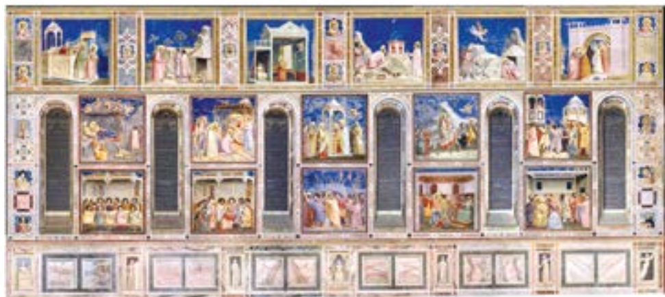
Левая сторона капеллы

сями на триумфальной арке перед абсидой продолжает историю Марии. Второй ярус справа начинает историю Иисуса Христа, рассказывая о его детстве. Второй ярус слева рассказывает уже о взрослых годах Иисуса. Арка пресбитерия включает ещё одно изображение: Предательство Иуды – встреча предателя с первосвященниками находится напротив встречи Марии и Елиза-