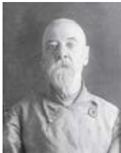
сщмч. Вениамин Фаминцев, тюремное фото

Священномученик Вениамин родился 19 января 1873 года в городе Коломне Московской губернии в семье священника Иоанна Фаминцева и его супруги Марии. Образование Вениамин получил в Московской Духов-