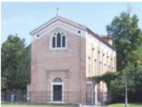
Капелла Скровеньи, внешний вид. г. Падуя, Италия

Цикл проторенессансных фресок капеллы Скровеньи не только является ключевой работой Джотто, но и входит в число главных произведений западного искусства. Ему удалось создать новый тип живописного мышления. Решения, найденные Джотто в этой работе, активно использовались мастерами последующих поколений. Был создан тип стенного панно, который с этого времени станет главной декоративно-композиционной темой монументальной живописи эпохи Возрождения.