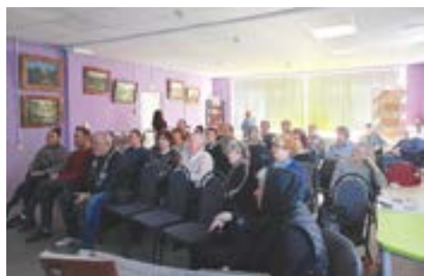
Заседание литературного общества в Талдомской центральной библиотеке

В минувший четверг в Центральной библиотеке Талдомского городского округа состоялось очередное заседание литературного общества им. И. С. Романова, к которому было привлечено внимание широкой общественности. Были приглашены специалисты, серьезно занимающиеся изучением биографии и творчества Сергея Антоновича Клычкова, православной культуры; местные краеведы.