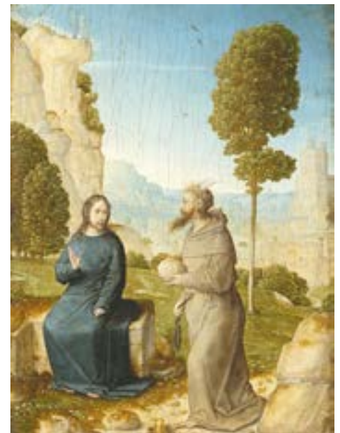
«Испытание Христа», Хуан де Фландес, XVI век

Последний раз искушая Иисуса, Дьявол, показывая ему все царства мира, над которыми он имеет власть, и предлагая их ему, надеялся смутить его человеческий дух и посеять сомнения в возможности осуществления Христом дела спасения человечества. Своим отказом Иисус показывает, что он не признаёт власти Сатаны над миром, который принадлежит Богу, которому и подобает поклонение.