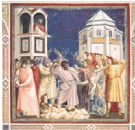
Избиение Вифлеемских младенцев

веты (как противопоставление). Третий ярус справа сосредотачивается на Страстях Господних, третий ярус слева продолжает их. Нижний ярус (цокольный) высотой около трёх метров изображает цикл из 14 Аллегорий Добродетелей и Пороков, составляющих фундамент человеческой земной жизни. Добродетели размещены по левой стене (с окнами) от алтаря и соответствуют блаженным, изображённым в сцене Страшного суда, пороки – по правой и соотнесены с проклятыми.