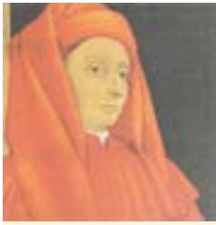
Джотто ди Бондоне

В нашей газете, говоря о различных церковных праздниках, мы используем различные произведения искусства для иллюстраций. Но, наверно, чаще всего за минувший год мы использовали фрагменты фресок из капеллы Скровеньи (г. Падуя, Италия) известного итальянского живописца и архитектора XIV века Джотто ди Бондоне. Его фигура – ключевая в истории западноевропейского искусства. Преодолевая византийскую иконописную традицию, Джотто стал основателем итальянской школы живописи, разработал новый подход к изображению пространства, является одним из первых представителей проторенессанса. Произведениями Джотто вдохновлялись Леонардо да Винчи, Рафаэль Санти, Микеланджело Буонарроти. В связи с этим, было бы справедливо рассказать о фресках из падуанской капеллы Скровеньи в целом.