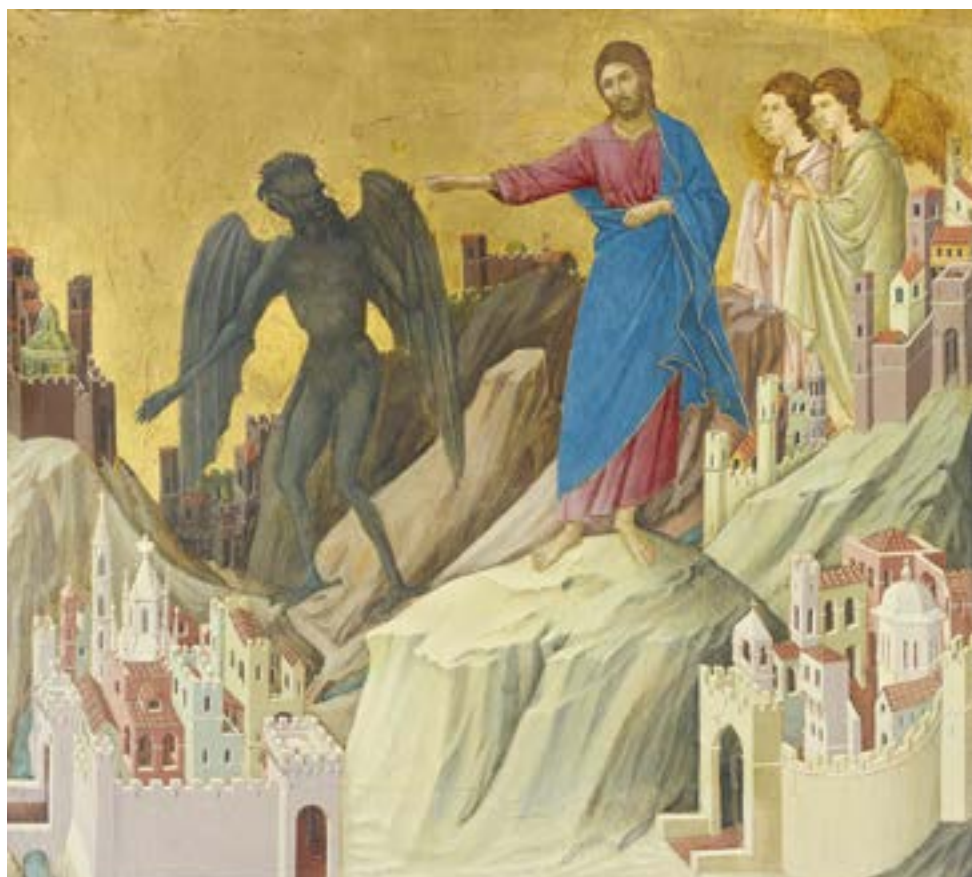
«Искушение Христа на горе», Дуччо ди Буонинсеня, 1308-1311 гг.

Анализируя тексты Евангелий, богословы считают, что Христос «возведён был Духом в пустыню, для искушения от диавола» непосредственно сразу после своего крещения. Преподобный Ефрем Сирин рассуждает о причинах того, почему Иисус был введён в пустыню именно Святым Духом: