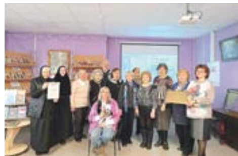
Докладчики на заседании

Сотрудники библиотеки поделились информацией о возможных совпадениях описаний городов в творчестве Сергея Антоновича с реальными населёнными пунктами Талдомского района и самого г. Талдома.