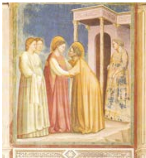
Посещение праведной Елизаветы Девой Марией

Правый верхний ярус посвящён истории Иоакима, отца Девы Марии. Левый верхний ярус следует за ним хронологически, это история девы Марии. Арка пресбитерия с роспи-