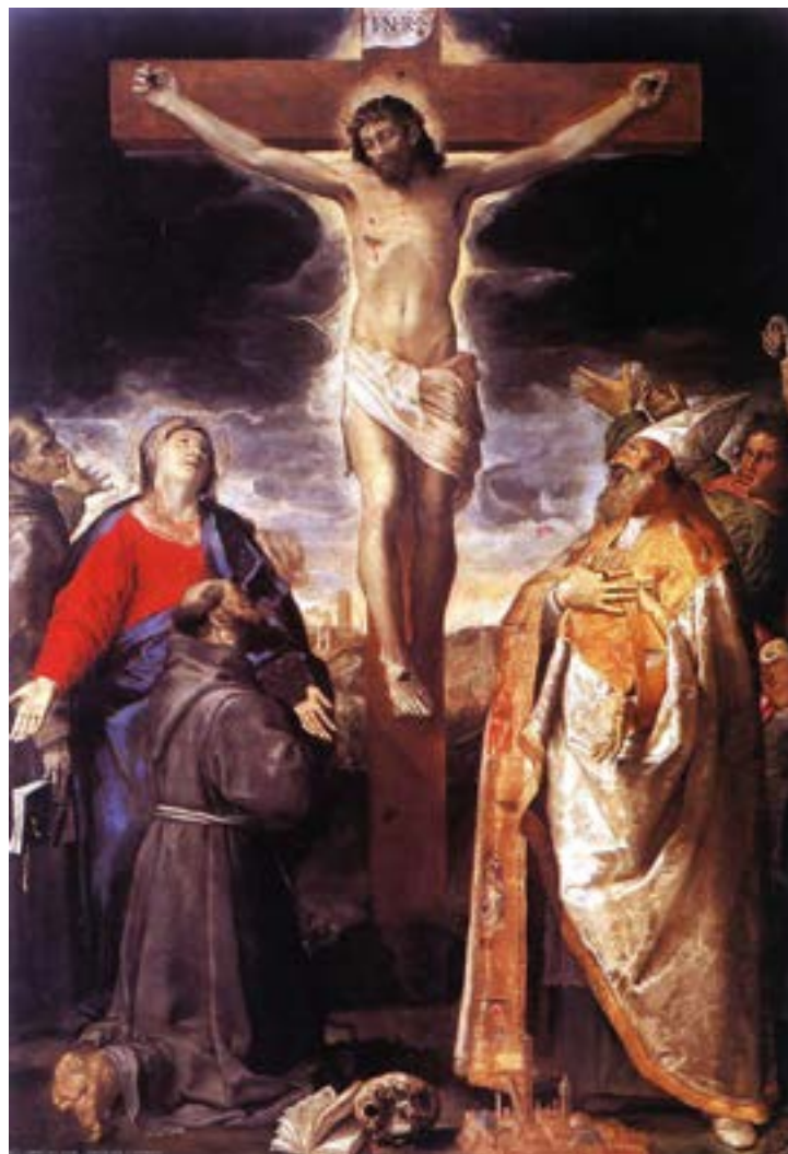
Аннибале Караччи. Распятие