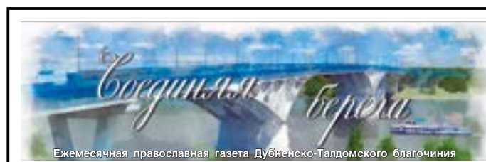
Ежемесячная православная газета Дубненско-Талдомского благочиния

Главный редактор протоиерей Павел Мурзич Выпускающий редактор Виталий Мельков Технический редактор Алексей Синицкий Дизайн Ольга Лабутина Верстка Павел Лесных