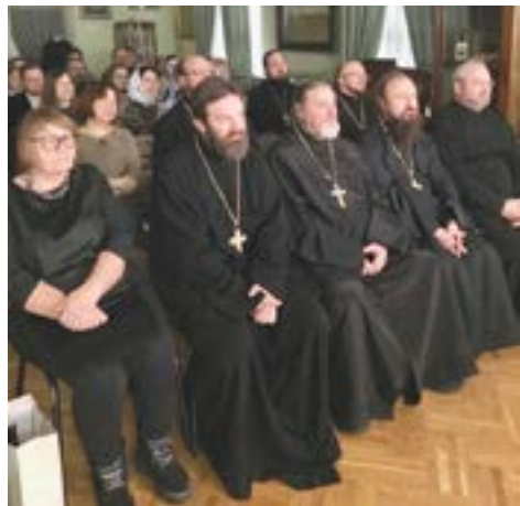
Презентация фильма о новомучениках Талдомских в Талдомском историко-литературном музее

Цель создания этого фильма – познакомить людей, а в особенности жителей Дубненского и Талдом-