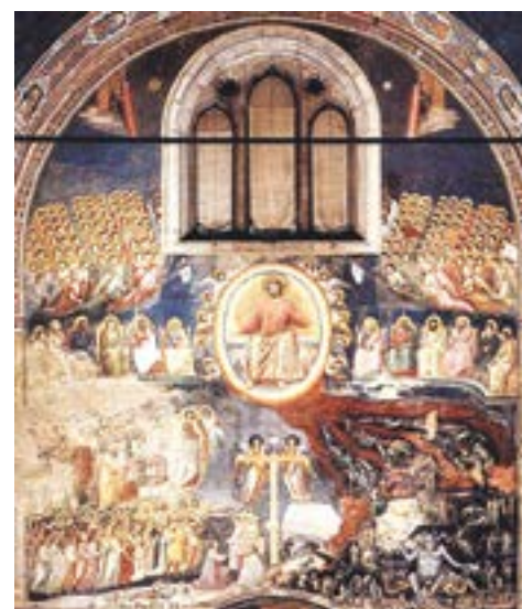
Фреска Страшный суд. Западная стена

Примечательны два интерьера ниш в хорах (коретти), написанных Джотто с использованием приёмов иллюзионистской живописи, возможно, первых trompe-l'oeil (обманок).