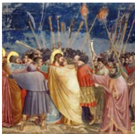
Поцелуй Иуды, фрески Джотто, капелла Скровеньи, г.Падуя, Италия

13). В Евангелии от Матфея говорится: «Тогда сбылось реченное через пророка Иеремию, который говорит: „и взяли тридцать сребреников, цену Оценённого, Которого оценили сыны Израиля.“» (Мф. 27:9). Пророк Иеремиа упоминает только 7 сиклей серебра и 10 сребреников (Иер. 32:9); возможно, в сумме они и составляли 30 сребреников. Но основное упоминание находится в Книге пророка Захарии: «И сказал мне Господь: брось их в церковное хранилище, – высокая цена, в какую они оценили Меня! И взял Я тридцать сребреников и бросил их в дом Господень для горшечника.» (Зах. 11:13).