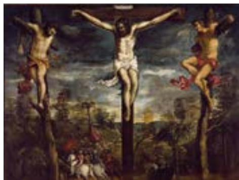
Якопо Тинторетто Распятие