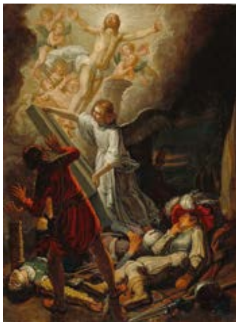
Питер Ластман. Воскресение Христово.

На картине Питера Ластмана запечатлен очень редкий вариант сюжета Воскресения. В центре – ангел Господень, отваливающий каменную плиту от гроба, где был положен Господь. Одни стражники спят крепким сном. Два других проснулись, один из них упал в забытьи, второй испуганно вскинул руки. «...Пилат сказал им: имеете стражу; пойдите, охраняйте, как знаете. Они пошли и поставили у гроба стражу, и приложили к камню печать» (Мф. 27:62–66). В верхней части полотна мы видим Христа, которого словно нет на земле, Он парит в облаках и божественном свете, его сопровождает сонм ангелов. Взору свидетелей Воскресения словно открылся портал, где в божественном свете пребывает Воскресший Христос, выведший из ада праведников. Действие происходит в темной пещере ночью, позади – открытый вход в гробницу, откуда