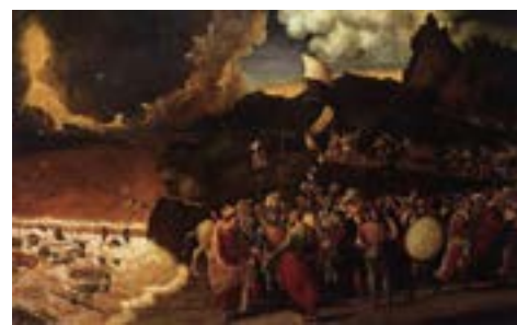
Гибель армии фараона в Красном море. Ок. 1518 г.

С другой стороны, прообразом самого пасхального (избавительного) агнца является овец, которого обнаружил Авраам на горе Иегова-Ире (досл. «Бог узрит») Быт. 22:1–18, а жертва Авраама своим сыном как прообраз жертвы Бога-Отца Сыном, избавление Исаака символизирует воскресение.