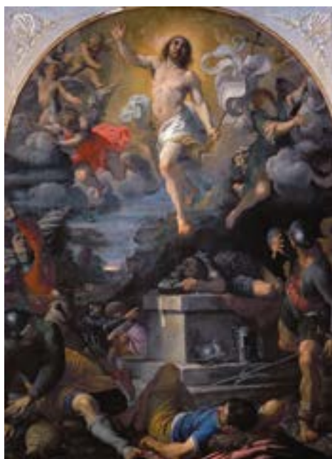
Аннибале Карраччи. Воскресение Христово.

Караваджо был в Риме до Карраччи, и он уже уловил это движение, в котором принимали участие оба художника. Достаточно интересно, что полностью зрелое произведение искусства Караваджо не появилось на свет, пока Карраччи не прибыл в Рим. Между этими двумя художниками были заметные различия: «Караваджо презирал принцип художественного отбора с его целью реализовать совершенный идеал природы, настаивая на абсолютной вере в индивиду-