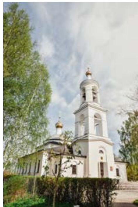
Современный вид храма

праздники. Одна из добрых традиций воскресной школы – паломничество по святым местам нашего края. Путешествия осуществляются за счет паломнической службы храма Похвалы Богородицы. Так, воспитанники воскресной школы уже побывали в Свято-Троицкой Сергиевой лавре, Ново-Иерусалимском, Саввино-Сторожевском, Александро-Невском (Маклаково) и Успенском (город Александров) монастырях.