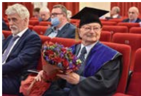
Академик Оганесян Ю.Ц., 2021 г.

ского университета. Я примерно говорил то, что я сейчас говорю, она во многом со мной соглашалась. Когда мы так подходим к чисто научному процессу: компьютер или человек, человеческая деятельность в науке и технике, с одной стороны, кажется, что сейчас такое положение... Что может добавить к этому религиозное толкование на эту тему? Мне кажется, не надо так задавать вопрос вообще. Вернемся к науке. В науке тоже многое неясно. Но если мы говорим «неясно, неясно» и мы должны встать, и, пока не будет ясно, мы не можем идти дальше, это было бы неправильно, стояли бы очень долго, поэтому в науке тоже принято: неясно, хорошо, но, если это даст нам возможность идти дальше, давайте это сделаем постулатом, запостулируем это, мы допустим, что это так, а потом вернемся и будем искать, где надо искать, так это или не так, может быть, это не там, где мы ищем. В нашей физике это