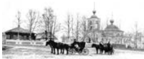
Храм Похвалы Пресвятой Богородицы в Ратмино, 1903 г.

В минувшие столетия на месте слияния рек Дубны и Волги в Ратмино, где сейчас красуется храм Похвалы Пресвятой Богородицы , который в этом году отметил свой престольный праздник 5-го апреля, стояли две деревянные церкви: Святителя Николая Чудотворца и Ильи Пророка. В 1714 году в храме святителя Николая сделали еще один придел в честь Похвалы Богородицы, который и стал главным, а церковь Ильи Пророка в 1817 году из-за ветхости совсем разобрали. Так начинается история храма Похвалы Богородицы в Ратмино.