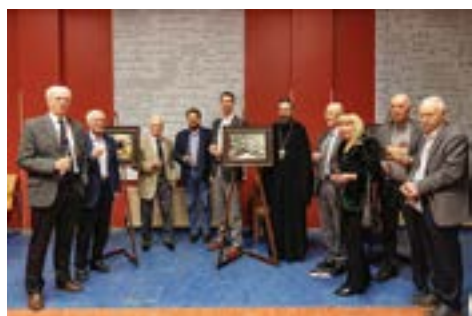
Открытие выставки, посвящённой творчеству П. Брейгеля Старшего

Понимаешь, насколько это необычно сейчас, и можем себе представить, насколько это было необычно тогда. И это жизнь, отданная вот этому. Это большое мужество. Питер Брейгель [Известный голландский художник, 1525–1569 гг. В первой части беседы Юрий Цолакович рассказывал о выставке, которую