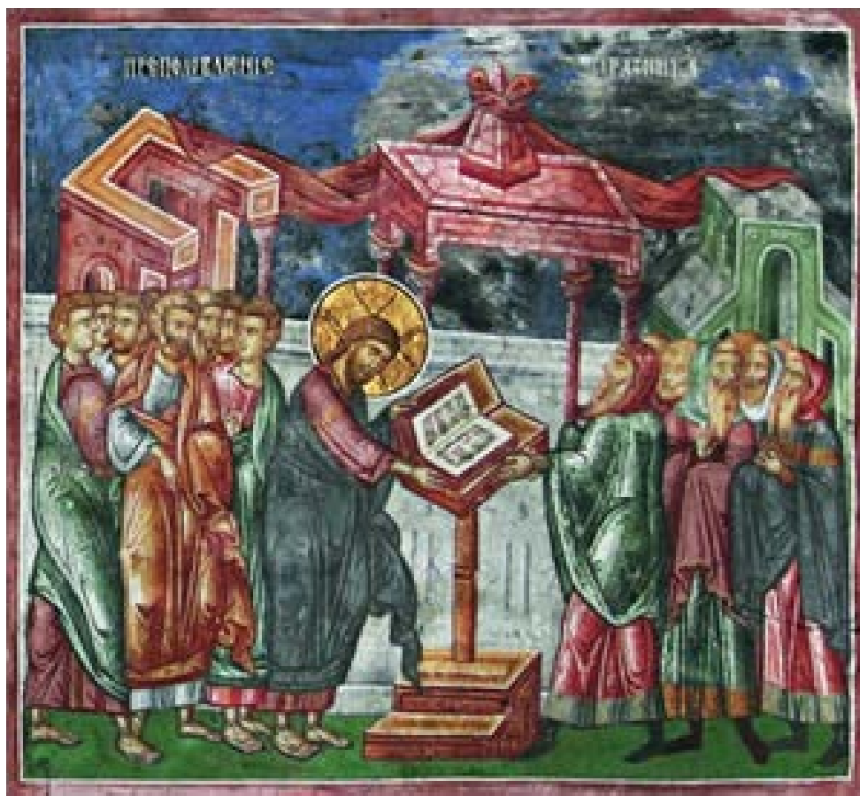
Церковь Преполовления Пятидесятницы в г. Псков

Прихожане храма Смоленской иконы Божией Матери