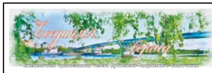
Ежемесячная православная газета Дубненско-Талдомского благочиния

Из книги «Бог есть: как самый знаменитый в мире атеист поменял свое мнение»