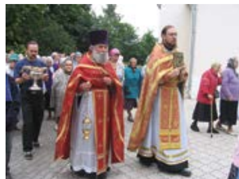
Пророк Илия 2007 г. (последняя служба батюшки в храме Похвалы Пресвятой Богородицы)