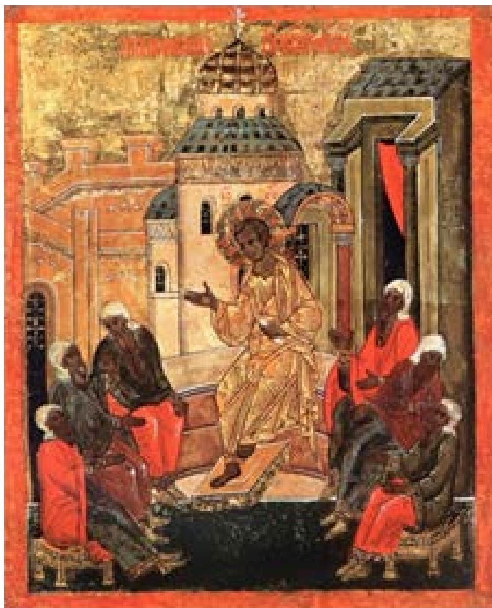
Икона Преполовение. Владими́ро-Суздальский музей. XVI век

Иконописные композиции на сюжет Преполовения Пятидесятницы известны в раннем христианском